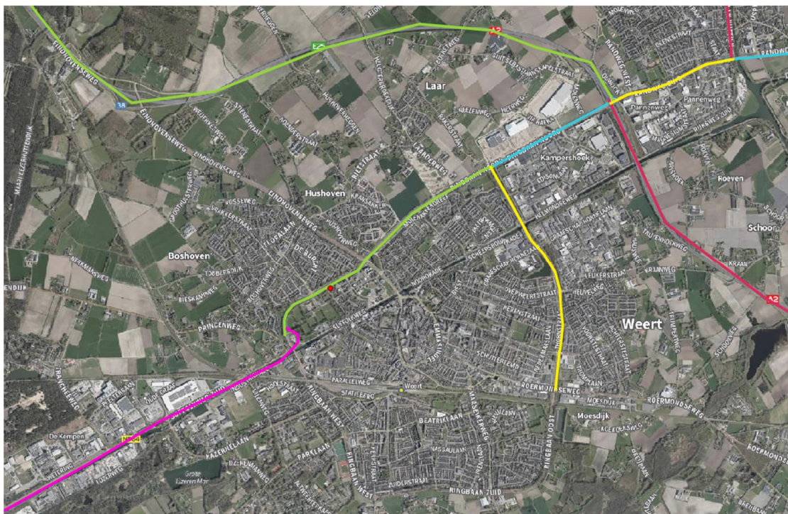
Afbeelding 2 Ligging wegen t.o.v. het plangebied (rode punt)