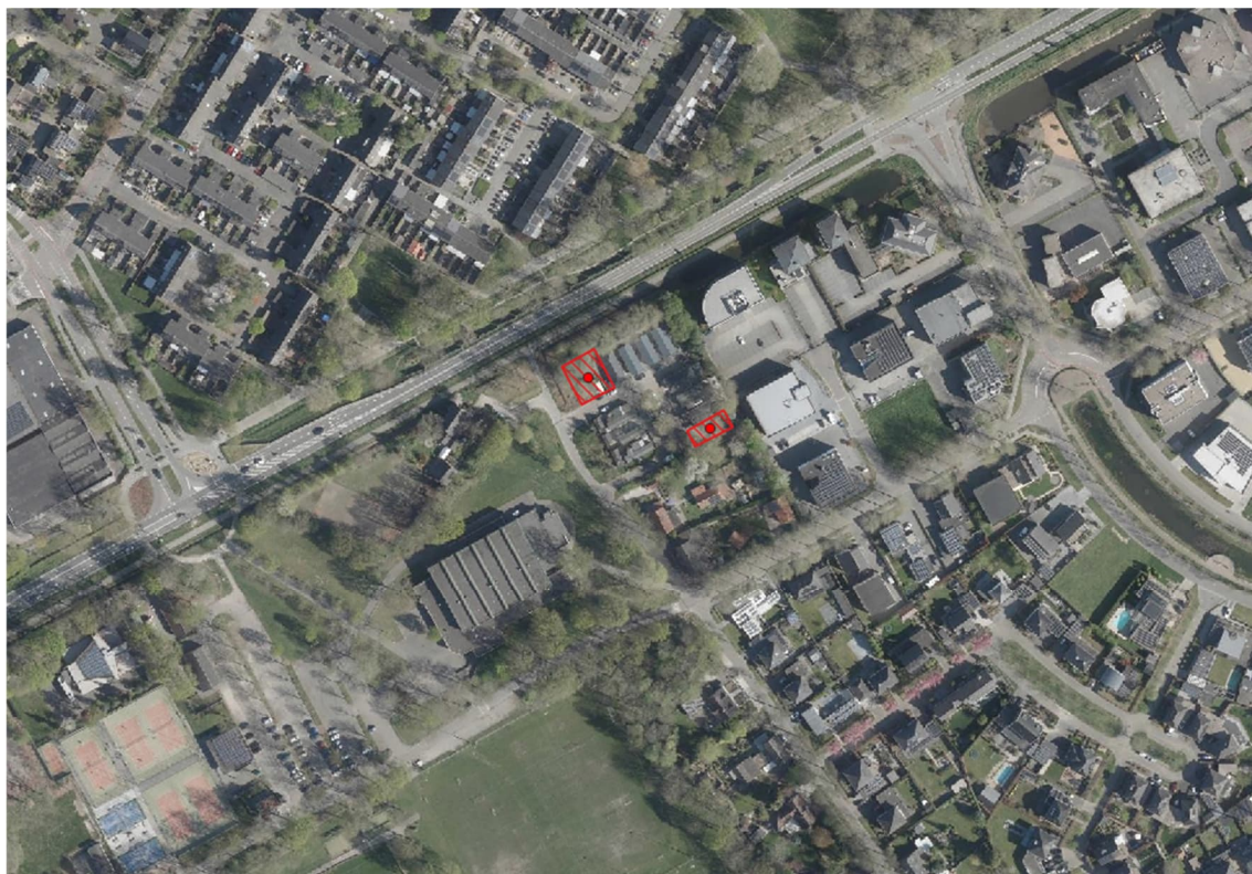
Afbeelding 1 Globale ligging plangebied (bron: PDOK)

De globale ligging van het plangebied (rode arcering) is onderstaand weergegeven.