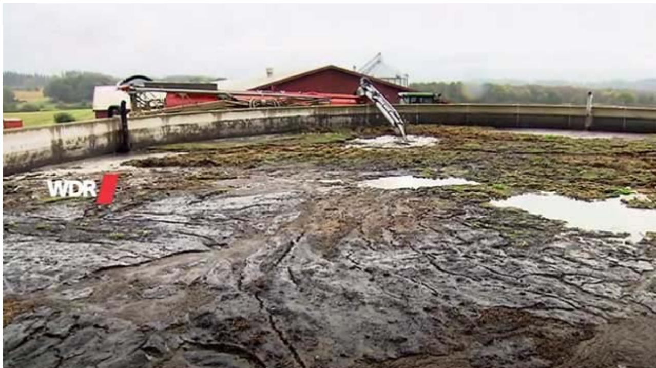
Mestopslag in de Eifel.

die mogelijk wordt gemaakt door politici, omdat er in deze regio's teveel mest is, maar te weinig land om dit groeiend mestoverschot op verantwoorde wijze te benutten.