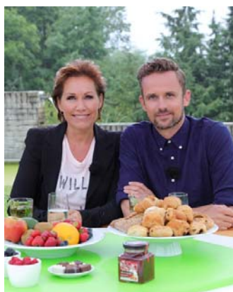
Kijkcijfers RTL Breakfastclub stemmen tot tevredenheid