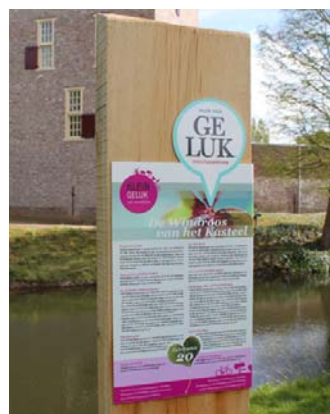
Geluksplekken Roerdalen in blad Slow Management