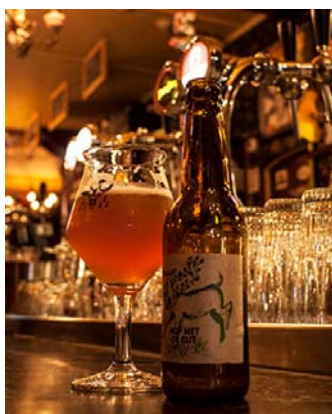
Duitse persreis Weert levert 2 mooie artikelen op Duits blog-kanaal op