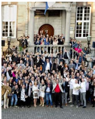
Roermond even culinair centrum van Europa