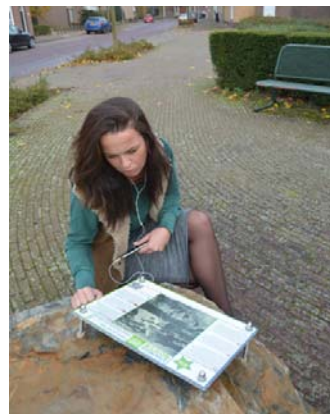
Liberation Route (inter) nationaal in de belangstelling