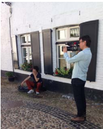
Japanse tv maakt opnames in Thorn