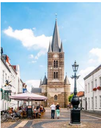
Maasstadjesroute in ANWB fietsspecial