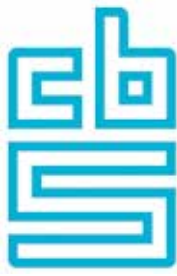
logo van het 'Centraal Bureau voor de Statistiek'

Verder komen veel vluchtelingen uit Afghanistan, Irak, Iran en Somalië.