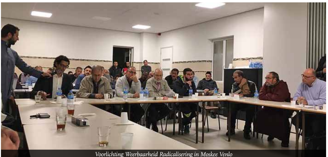
Voorlichting Weerbaarheid Radicalisering in Moskee Venlo