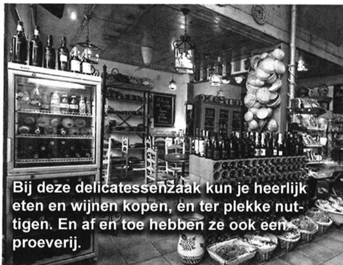
Bij deze delicatessenzaak kun je heerlijk eten en wijnen kopen, en ter plekke nuttigen. En af en toe hebben ze ook een proeverij.