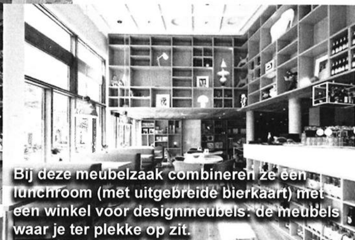
Bij deze meubelzaak combineren ze een lunchroom (met uitgebreide bierkaart) met een winkel voor designmeubels: de meubels waar je ter plekke op zit.