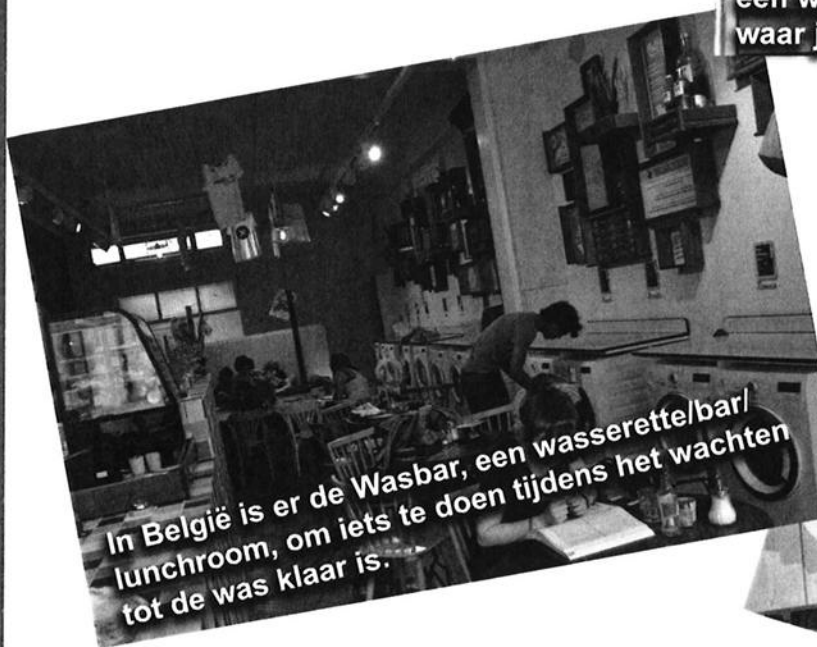
In België is er de Wasbar, een wasserette/bar/lunchroom, om iets te doen tijdens het wachten tot de was klaar is.