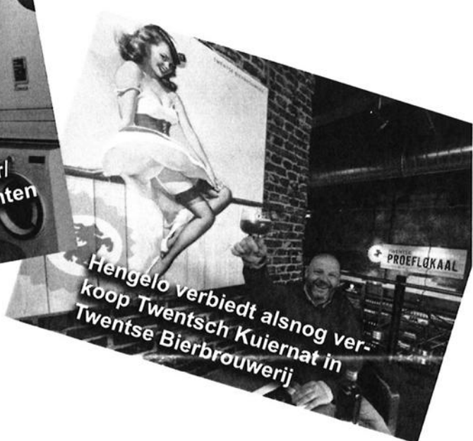
Hengelo verbiedt alsnog verkoop Twentsch Kuiernat in Twentse Bierbrouwerij