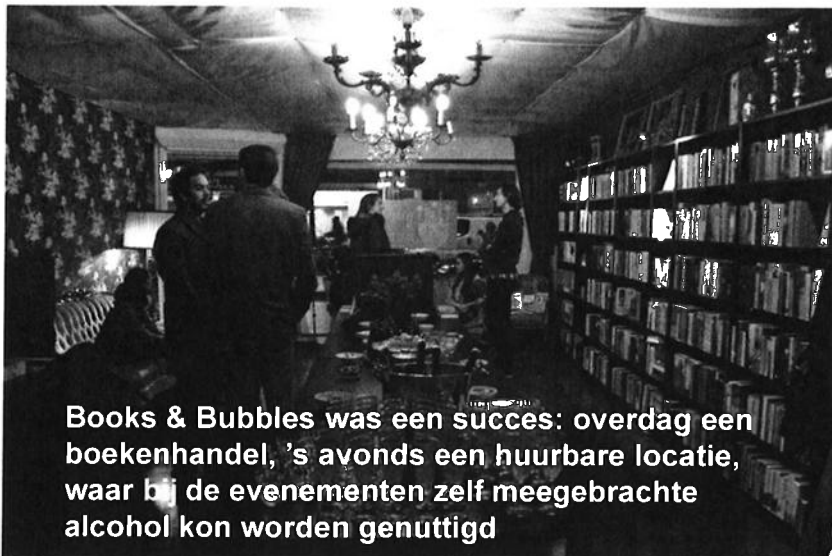
Books & Bubbles was een succes: overdag een boekenhandel, 's avonds een huurbare locatie, waar bij de evenementen zelf meegebrachte alcohol kon worden genuttigd