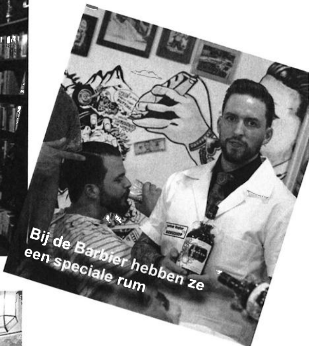
Bij de Barbier hebben ze een speciale rum