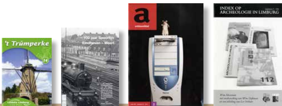
Selectie periodieken in de studiezaal

Het onderdeel 'Kranten' zoals dat op de website te zien is bevat een dagelijkse selectie titels van artikelen uit Dagblad De Limburger en het Land van Weert/De Trompetter. Geselecteerd worden die artikelen die een directe relatie met Weert en omgeving hebben. Vanwege de auteursrechten zijn de artikelen zelf enkel in de studiezaal beschikbaar. In de studiezaal is eveneens Dagblad De Limburger op microfiche aanwezig tot 2008. Daarnaast zijn er op de website ook integraal de edities van 'Kanton Weert', 'Op de Keper' en 'Het Land van Weert' en meerdere kranten uit Midden Limburg variërend van de periode 1856 tot midden jaren zestig van de vorige eeuw. De Staatsbladen zijn eveneens op microfiche in de studiezaal aanwezig.