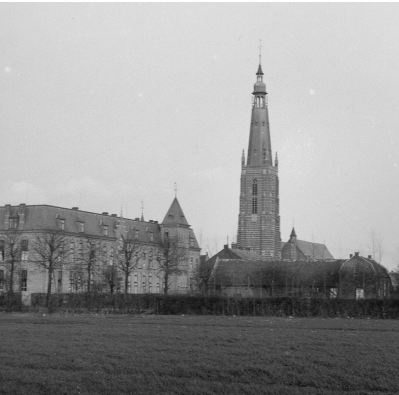
Bisscoppelijk College en St. Martinuskerk Collectie Glasnegatieven Paters van de Heilige Geest Fatima GAW Beeldbank CPHG.233