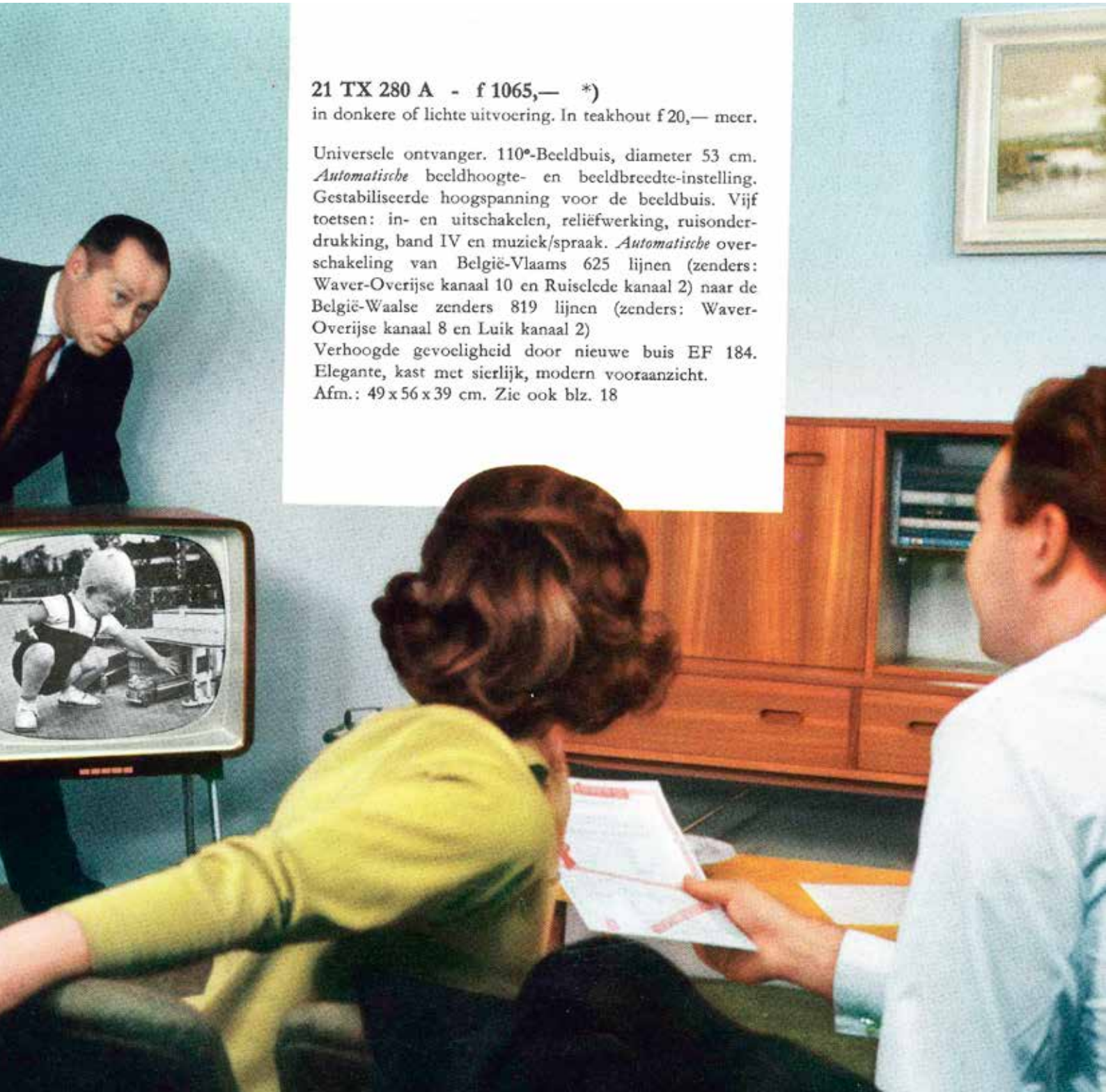
Reclamefolder Philips televisie omstreeks 1960

Universele ontvanger. 110°-Beeldbuis, diameter 53 cm. Automatische beeldhoogte- en beeldbreedte-instelling. Gestabiliseerde hoogspanning voor de beeldbuis. Vijf toetsen: in- en uitschakelen, reliëfwerking, ruisonderdrukking, band IV en muziek/spraak. Automatische overschakeling van België-Vlaams 625 lijnen (zenders: Waver-Overijse kanaal 10 en Ruislede kanaal 2) naar de België-Waalse zenders 819 lijnen (zenders: Waver-Overijse kanaal 8 en Luik kanaal 2) Verhoogde gevoeligheid door nieuwe buis EF 184. Elegante, kast met sierlijk, modern vooraanzicht. Afm.: 49 x 56 x 39 cm. Zie ook blz. 18