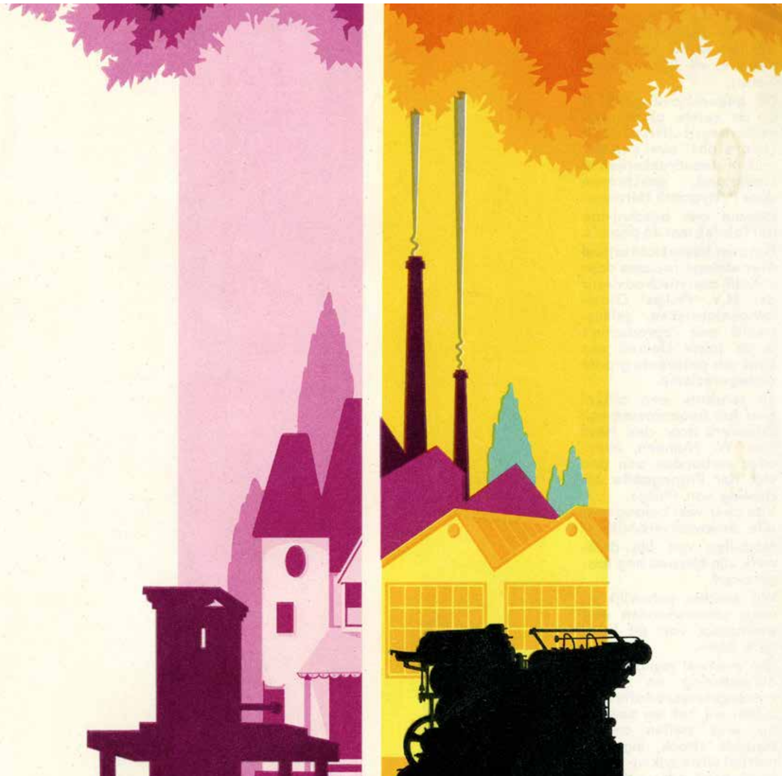
Kleurenproef Collectie Smeets Drukkrijen