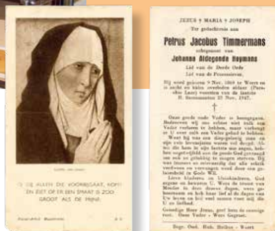
Bidprentje uit 1947 voorzijde en achterzijde