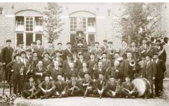
Links Stedelijke Harmonie St. Antonius anno 1920 rechts: Minister Ronald Plasterk bij opening 'Rembrandt in Zwart - Wit'