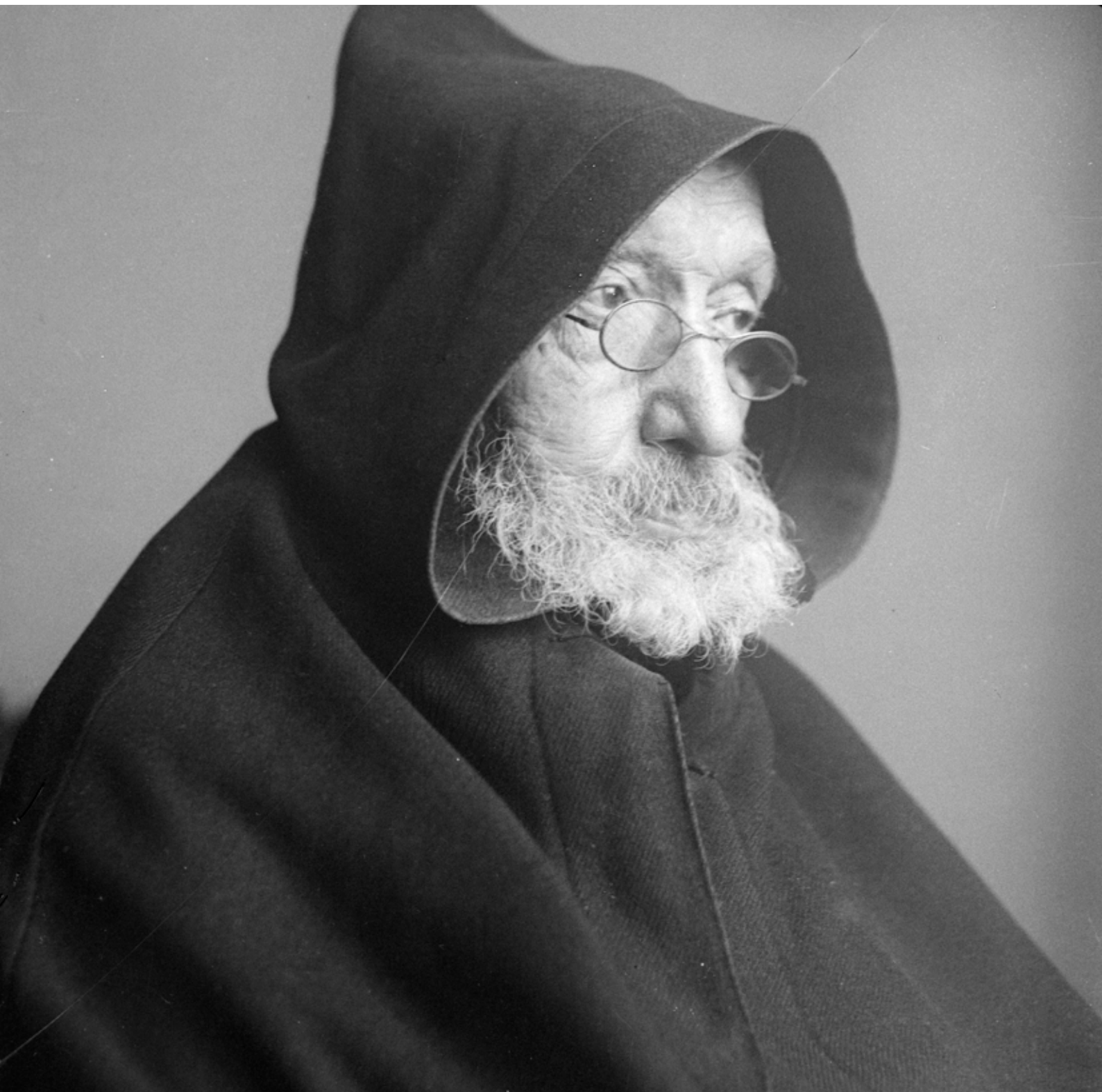
Portret Broeder Pius CPHG.193