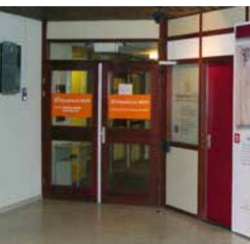
Entree kantoren en studiezaal Erfgoedcluster

Gemeentemuseum De Tiendschuur zal in 2015 ontruimd worden en vrijkomen voor verkoop. Lees hierover verder in de paragraaf 'Depotbeheer archieven en museale objecten'.