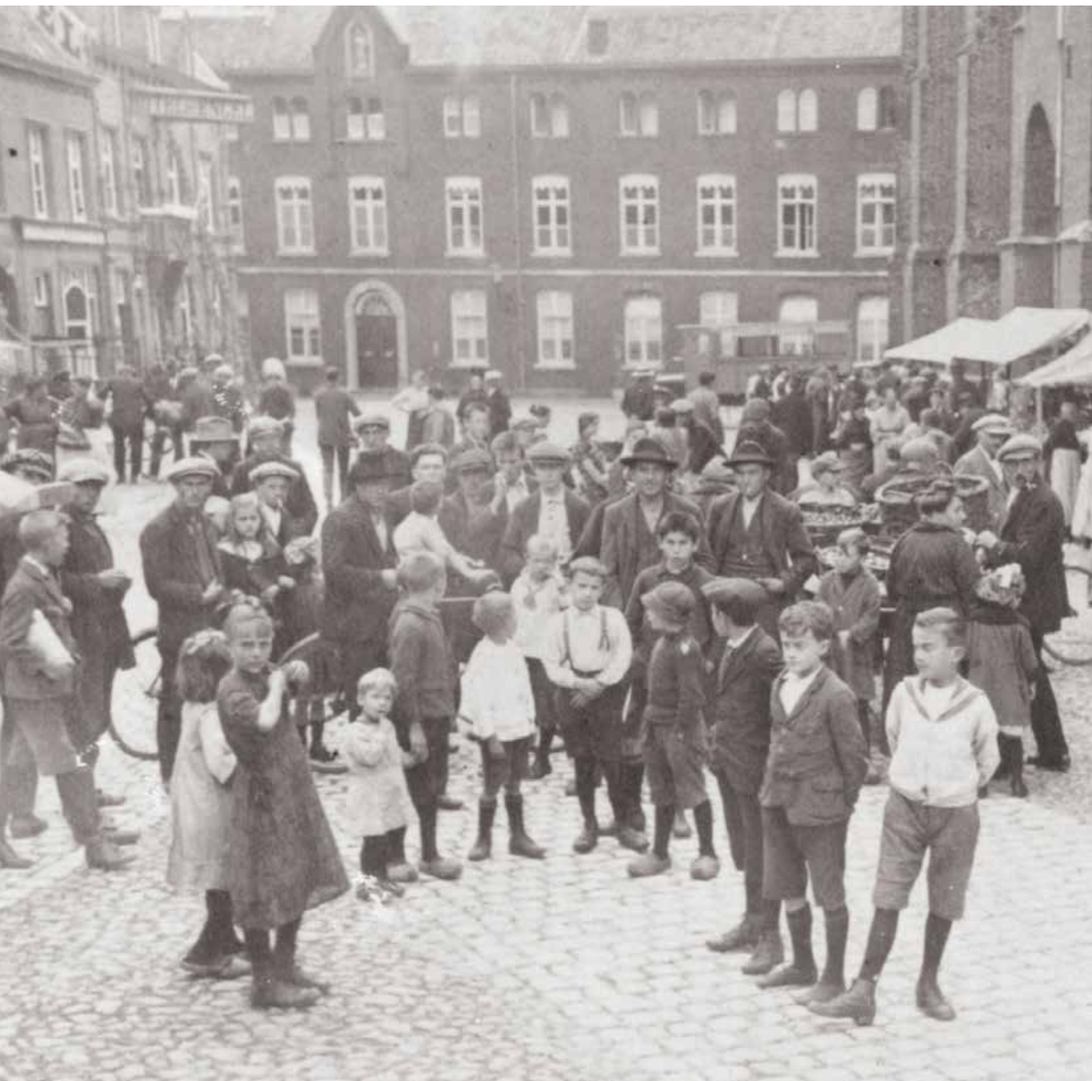
Korenmarkt anno 1926