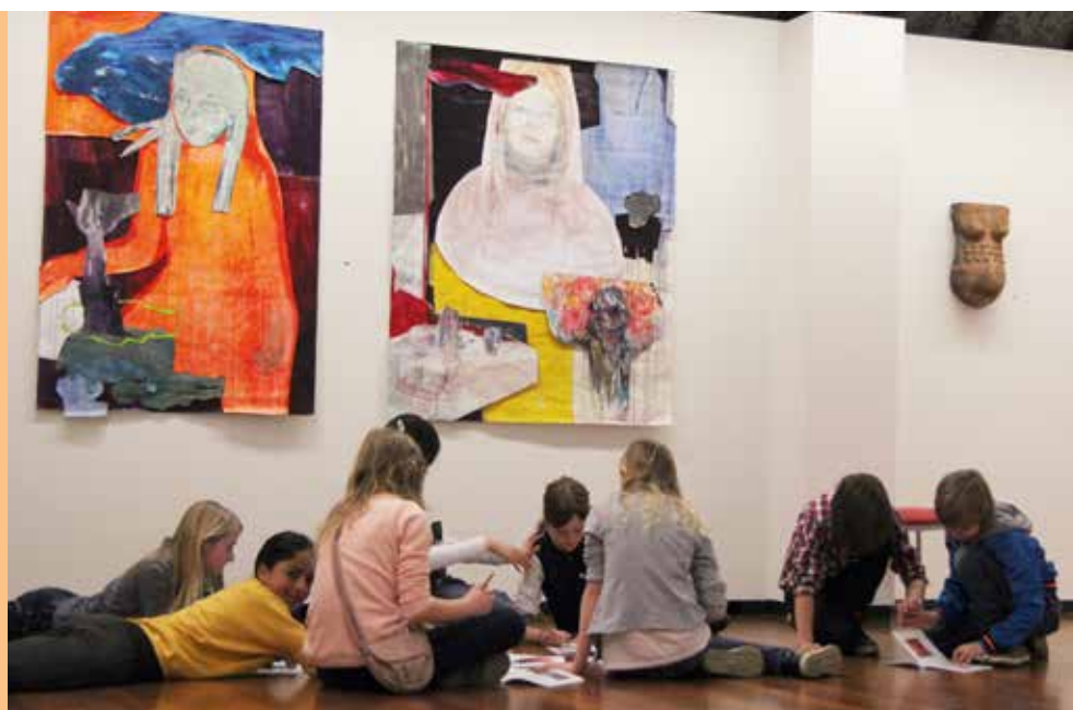
Scholieren bekijken moderne kunst GAW Beeldbank D.B.116.2008

De twee gemeentelijke musea hebben in het verslag jaar gezamenlijk meer dan 20.500 bezoekers. Dit is een toename van iets meer 5% in vergelijking met het totaal van 19.500 bezoekers in 2013. Het Gemeentemuseum Jacob van Horne heeft dit jaar bijna 16.250 bezoekers getrokken. In 2013 is dat ruim 15.700 geweest. De vaste collectie bestaat uit museale objecten over de geschiedenis van de minderbroeders franciscanen in Weert en Nederland. Samen met de tentoonstellingen 'Moderne spiritualiteit' en '750 Sacramentsdag' zijn hier bijna 1.350 betalende bezoekers geweest.