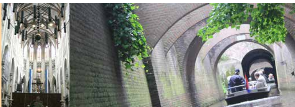
Links St. Janskathedraal Rechts Binnenbieze Den Bosch

Wij zijn blij dat deze vrijwilligers, vaak al vele jaren, ons helpen. Als dank voor hun inspanningen bieden wij dan ook graag jaarlijks een excursie aan. In 2014 is de groep naar Den Bosch geweest en heeft daar heeft men een bezoek kunnen brengen aan het voor 53 miljoen Euro vernieuwde Noord-Brabants museum, het Hieronymus Bosch Museum, de St. Jan kathedraal en natuurlijk een rondvaart op de fraai gerestaureerde Binnendieze. Voorts hebben de vrijwilligers een bescheiden kerst aandenken ontvangen. Daarnaast kent de sectie Musea voor de vrijwilligers een eigen lief-en leedpotje. In het verslagjaar zijn vijf vrijwilligers door de wethouder Cultuur vanwege een jubileum bijzonder in het zonnetje gezet. 1