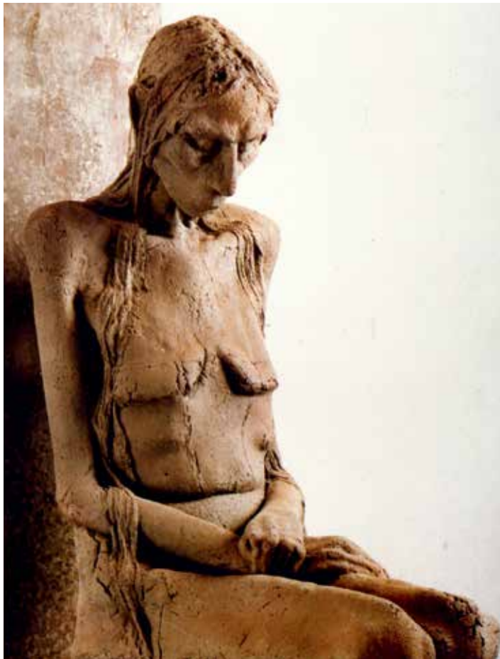
Uitleen aan het 'Museum aan het Vrijthof' Maastricht beeld Maria Magdalena van Desiré Tonnaer GMW inv. nr. 3588