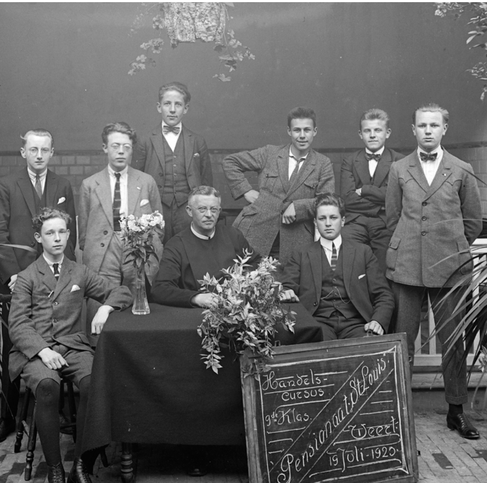
Handelskursus Pensionaat St. Louis Collectie Glasnegatieven Paters van de Heilige Geest Fatima GAW Beeldbank CGHG.537