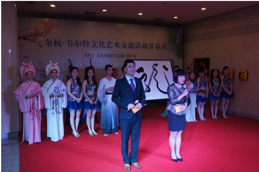
Ceremoniële opening van de return van Art Spectrum