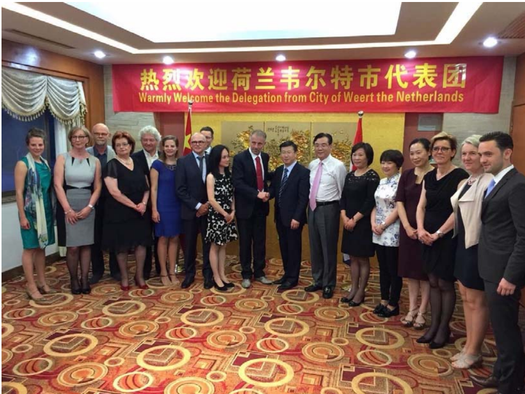
Groepsfoto tgv het welkomstdiner op dinsdag 12 mei in stadhuis van Yuhang