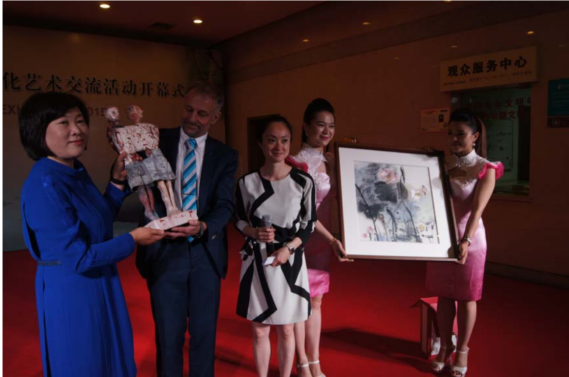
Uitwisseling van de hoofdcadeau's