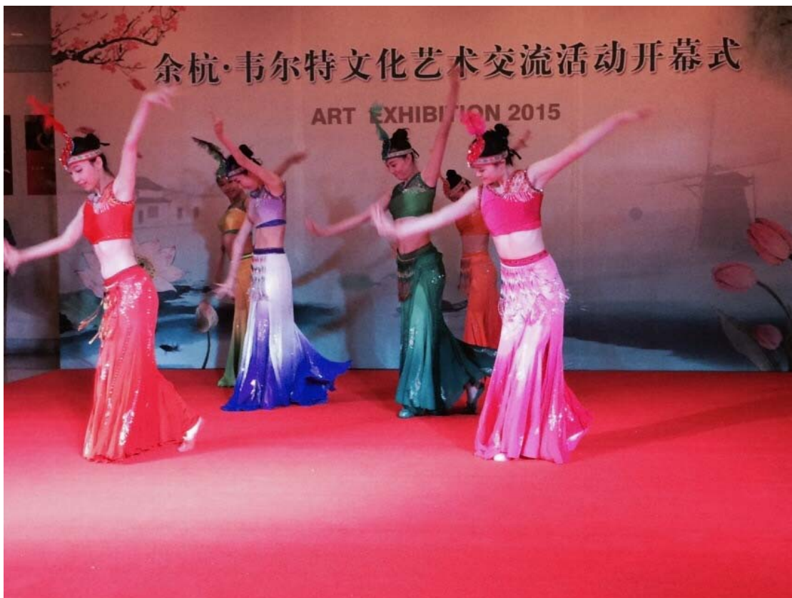
Een van de shows voorafgaande aan de officiële opening van de kunstexpositie Art Spectrum