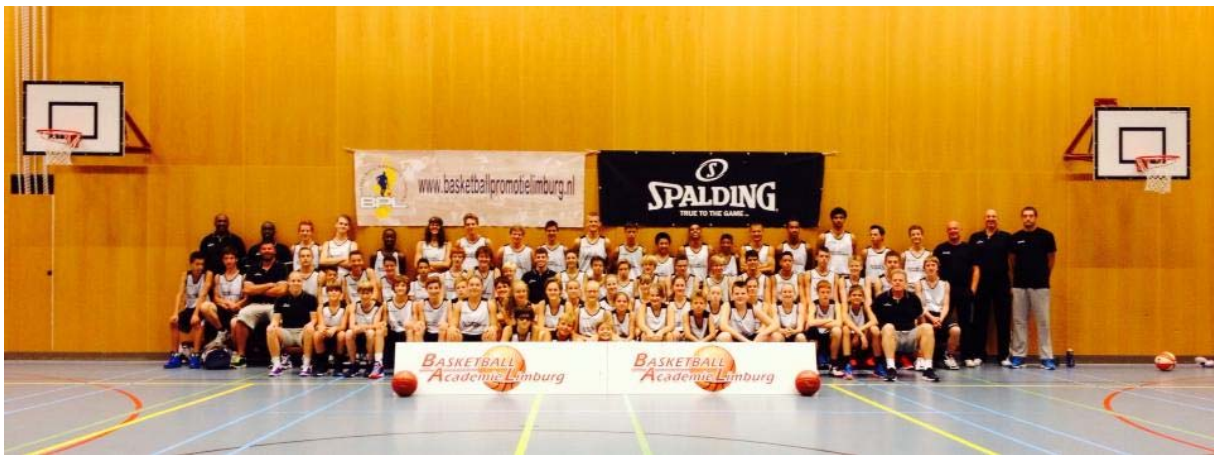
Deelnemers RTC Basketbal 2015

Momenteel heeft het RTC 12 deelnemers (zowel jongens als meisjes). Dit lijkt weinig, zeker in vergelijking met basketbal en volleybal. Dit komt echter omdat handboogschieten een individuele sport is en geen teamsport. De bond is ook kritisch bij de toelating van talenten. Er moet sprake zijn van echt talent met potentie tot doorstroming op landelijk niveau. Handboogschieten gebeurt zowel indoor als outdoor. Het RTC maakt voor de indooractiviteiten gebruik van de gymzaal van Het College. In de zomer wordt het gemeentelijke recreatieveld achter Het College gebruikt. Hier wordt in de zomer nu al geschoten door handboogvereniging de Batavieren Treffers.