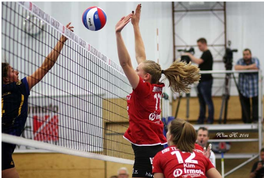
De dames van VC Weert in actie in het seizoen 2014-2015

Onderstaand worden de aanbevelingen nader toegelicht en ingevuld. Ook wordt het proces voor samenwerking met de provincie Limburg nader toegelicht.