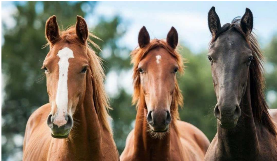
Sportpaarden in rust