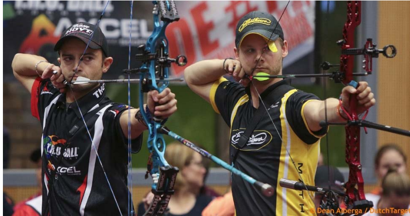
Concentratie van schutters bij het evenement Kings of Archery