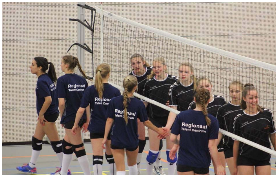
Deelnemers aan het RTC volleybal

Het NOC * NSF benoemt samenwerking tussen sport, onderwijs, overheid, en overige partijen als zorg en bedrijfsleven met gelijkwaardige partnerships van cruciaal belang voor het realiseren van RTC's.