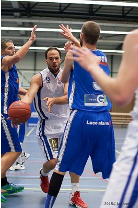
Scene wedstrijd Stichting BSW

verenigingsachterban. De vereniging vormt normaliter een sterk element in de publieke achterban. Het eredivisieteam is immers het hoogste verenigingsteam. De achterban van de vereniging BSW is de laatste jaren geleidelijk verdwenen. In 2012 ontstond er onvrede tussen het Regionaal Talenten Centrum (RTC) basketbal en de vereniging BSW over de samenwerking. Dit leidde in 2013 tot de oprichting van de nieuwe vereniging BAL, gelieerd aan het RTC. De verenigingen BSW en BAL bestonden in 2013 en 2014 naast elkaar en waren concurrerend. In 2015 is gezamenlijk besloten tot een nieuwe structuur. BSW behoudt het eredivisieteam en één talententeam in de leeftijdscategorie tot 24 jaar. Alle andere activiteiten voor breedtesport en talentontwikkeling (tot 21 jaar) vinden plaats bij de combinatie RTC/BAL. Alle partijen willen vanuit deze nieuwe structuur bouwen aan een goede samenwerking en de eenheid binnen het Weertse basketbal weer herstellen.