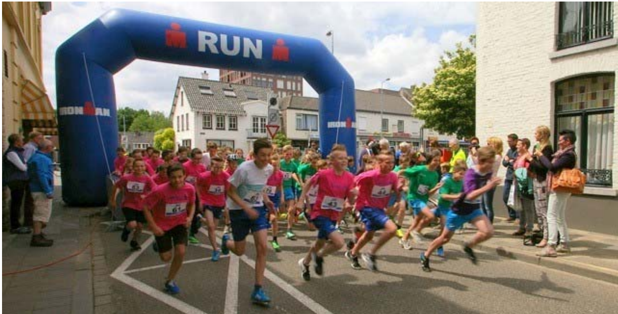
Scholierenactiviteit bij Stadstriathlon Weert

In 2015 wordt ingezet op de ontwikkeling van een visie voor evenementen die passen bij Limburg en een maximaal economisch en maatschappelijk effect opleveren. Dit zijn zowel incidentele evenementen (bijvoorbeeld een Europees Kampioenschap) als evenementen met een jaarlijks vaste waarde voor Limburg. Tot de gewenste internationale evenementen behoren o.a. de wielersport, paardensport en triathlon. Ook hierin zoekt de provincie samenwerking met gemeenten.