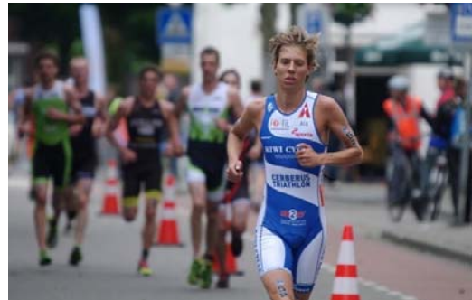
Impressie Stadstriathlon 2015