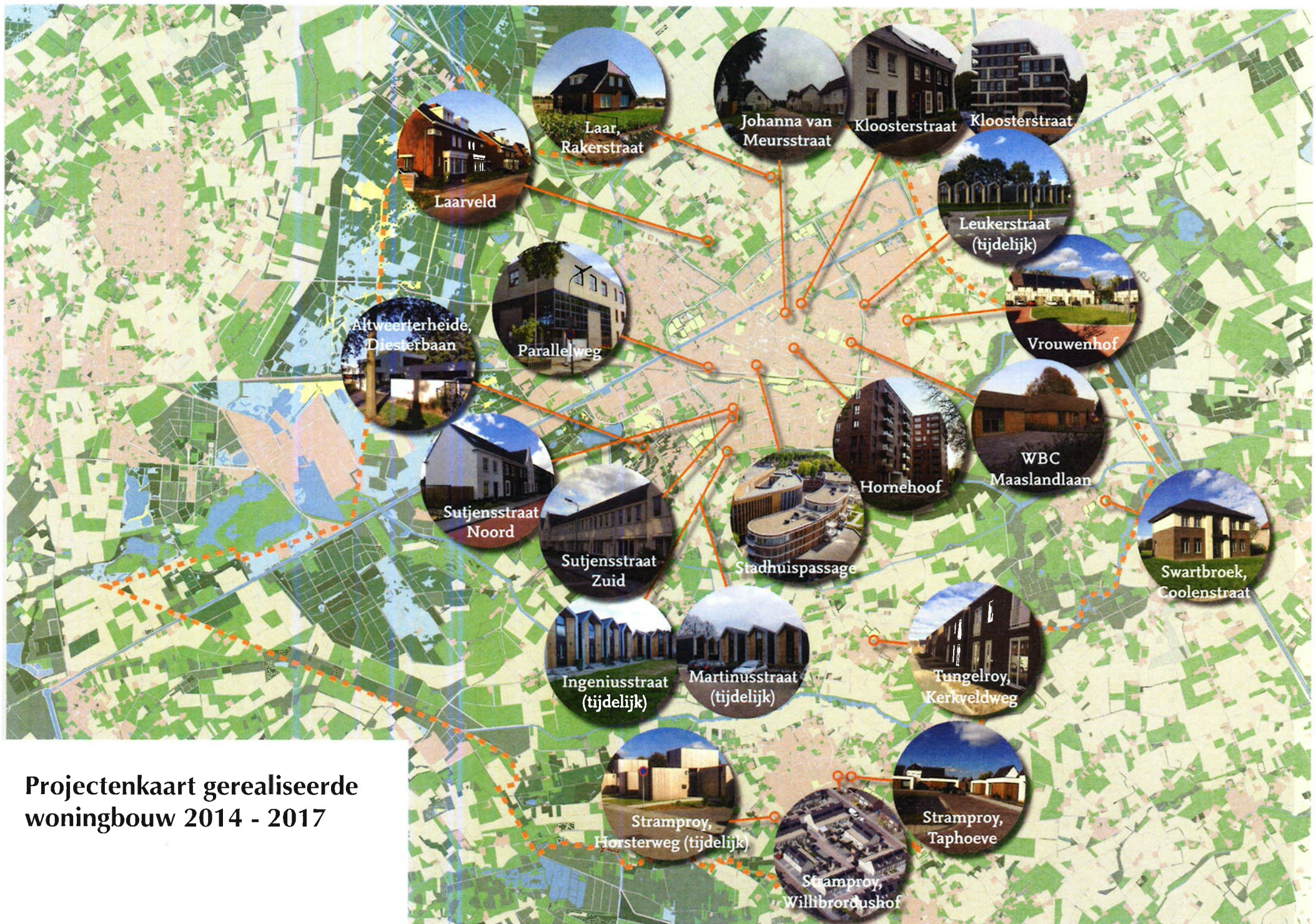
Projectenkaart gerealiseerde woningbouw 2014 - 2017