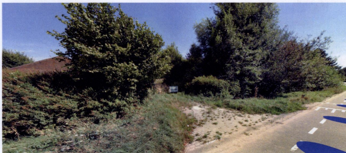
Beeld vanaf de straat