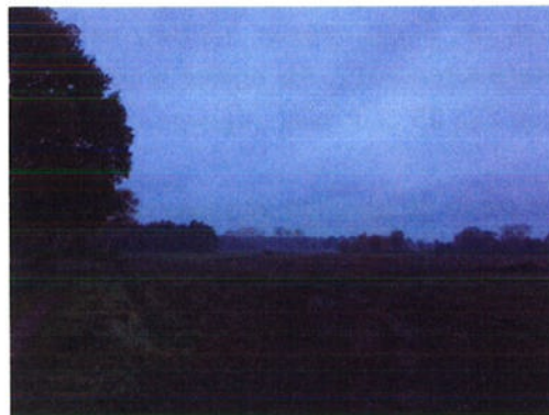
12-11: Afstand tot bomenrij 25 meter