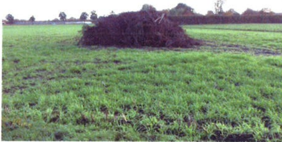
10-11: situatie vanaf openbare weg.