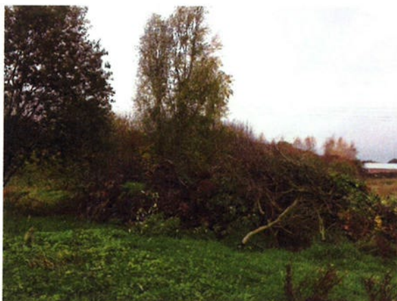
Situatie 10-11- '17

Op zaterdag 11 november is omstreeks 15:45 uur geconstateerd dat de buurtvereniging een hoop van ongeveer 10 m 3 had gemaakt. Ondanks dat de afstand tot de dichtstbijzijnde woningen en struiken minder dan 50 was is maatwerk toegepast. Situatie akkoord.