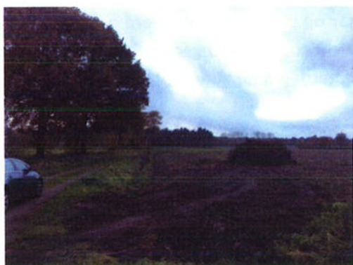
11-11: Afstand tot bomenrij 10 meter