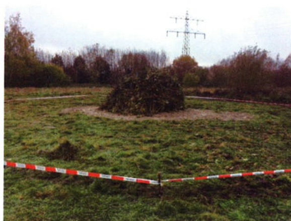
St. Maartensvuur 11-11- '17