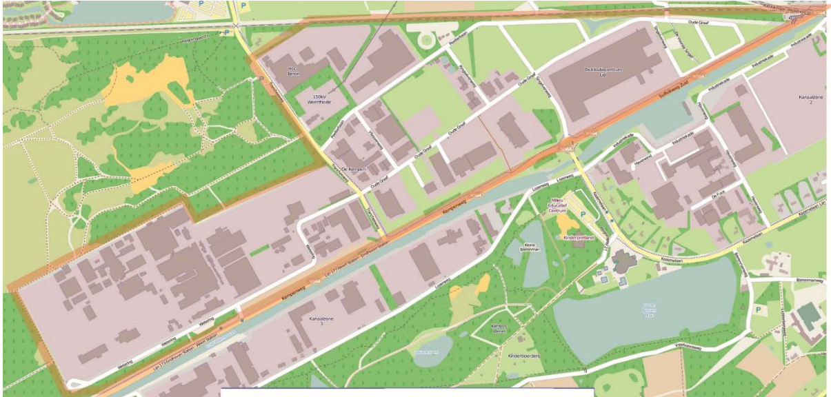
Afbeelding 1. Werkingsgebied BIZ