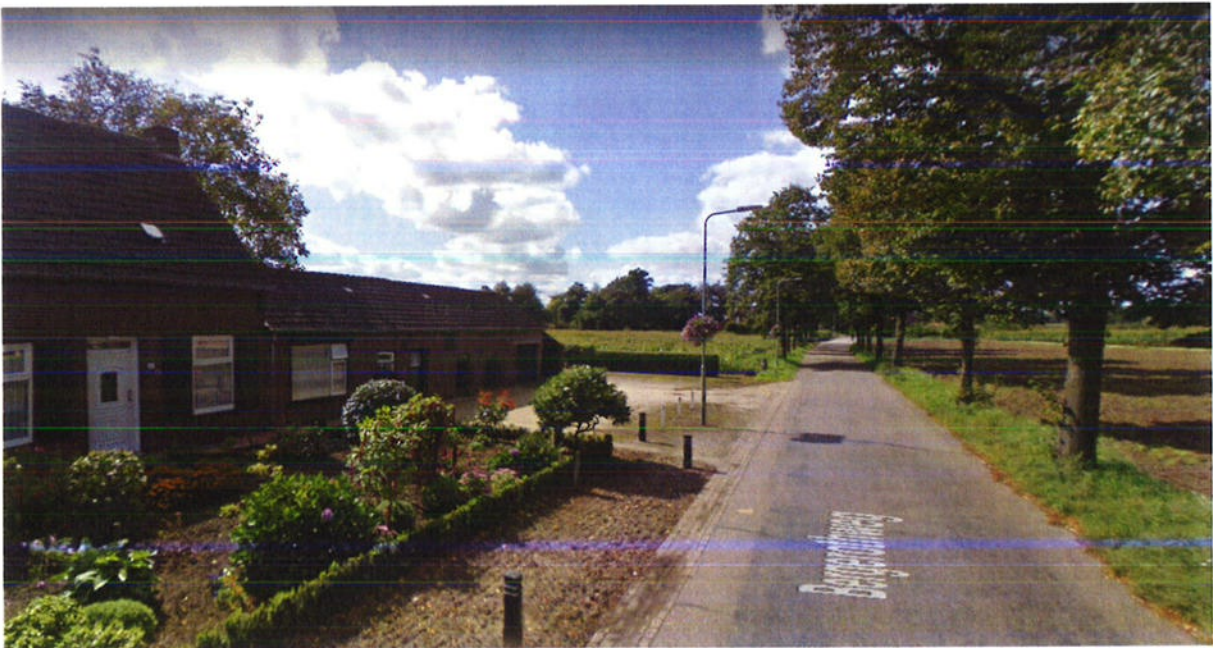
Streetview Bergerothweg 81 en perceel