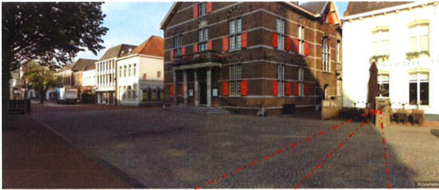
Korenmarkt / Markt, zichtlijnen op de Rog op de sokkel van het carnavalsmonument De Naas