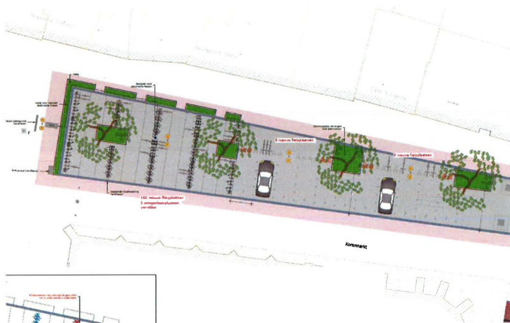
Korenmarkt, herinrichting najaar 2018