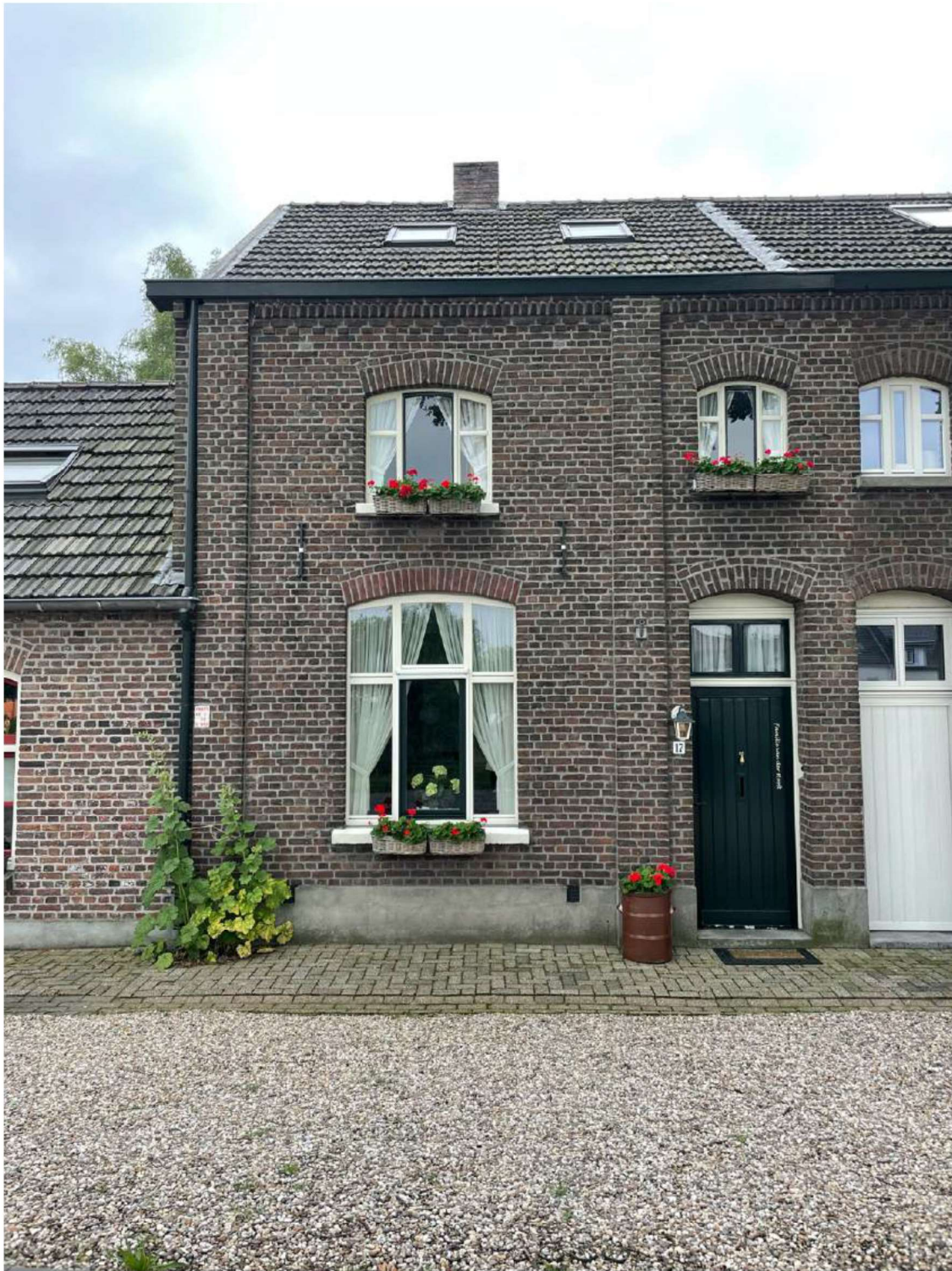
Foto 31 Voorgevel van de woning Scheepsbouwkade 17.