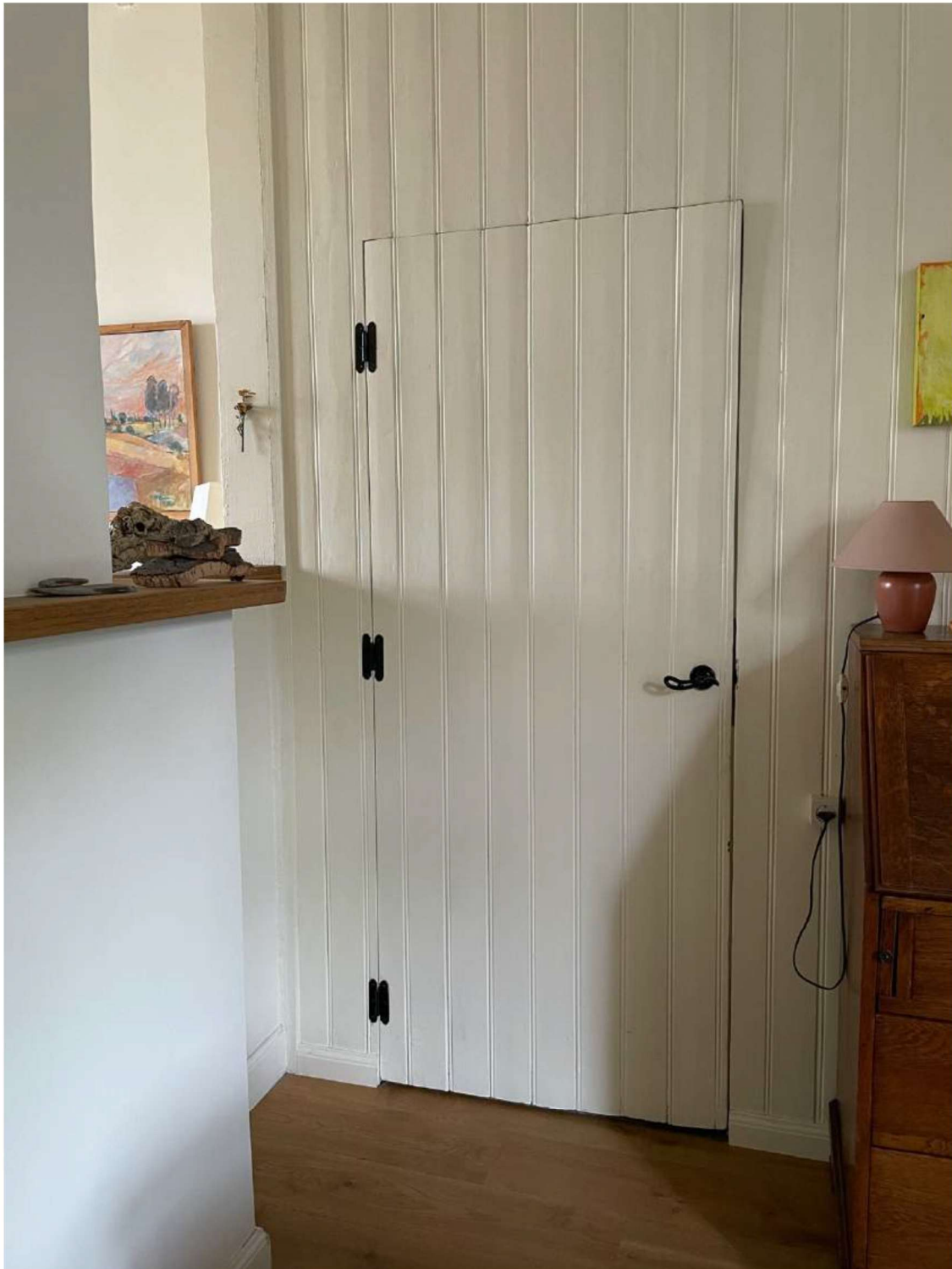
Foto 32 De zijwand met deur die toegang biedt tot de trap naar de kelder. De wand is opgebouwd uit verticaal geplaatste planken met kraal, geschilderd in een roomwitte kleur.