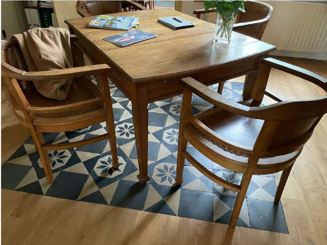
Foto 33 Herlegd tableau van de originele Portugese cementtegels, ter plaatse van de woonkamer. Gemaakt door: Klement Rentmeesters (2021)