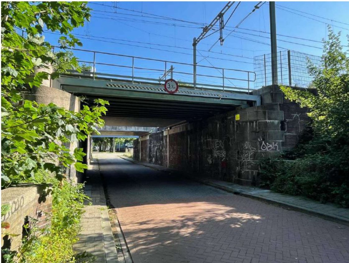
Foto 4 Dubbele spoorbrug met bruggenhoofden, Louis Regoutstraat, gezien in noordelijke richting. Gemaakt door: Klement Rentmeesters (2021)

De bruggenhoofden bij spoorbrug zijn van algemeen belang vanwege de cultuurhistorische waarde, architectonische en stedenbouwkundige waarde. De bruggenhoofden zijn van algemeen belang vanwege de cultuurhistorische waarde als bijzondere uitdrukking van een typologische ontwikkeling en de structurele groei die Weert doormaakte als gevolg van de industrialisatie en de aanleg van de Zuid-Willemsvaart. De bruggenhoofden zijn van algemeen belang vanwege de architectuurhistorische waarde vanwege de karakteristieke vormgeving, materiaalgebruik en detaillering. De brug heeft een stedenbouwkundige waarde vanwege het belang van het beeldbepalende karakter als onderdeel van de ontwikkelingen in het transportnetwerk van Weert.