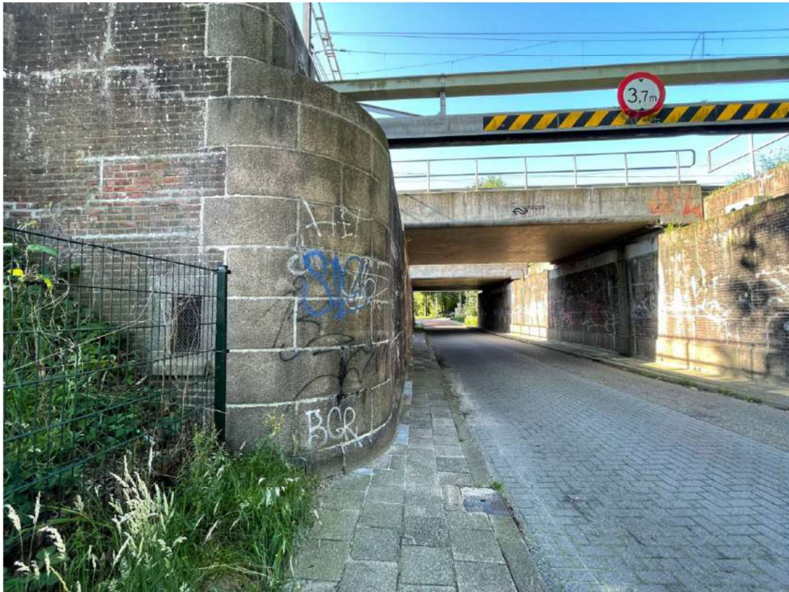
Foto 5 Zuidelijke bruggenhoofd Louis Regoutstraat. Gemaakt door: Klement Rentmeesters (2021)