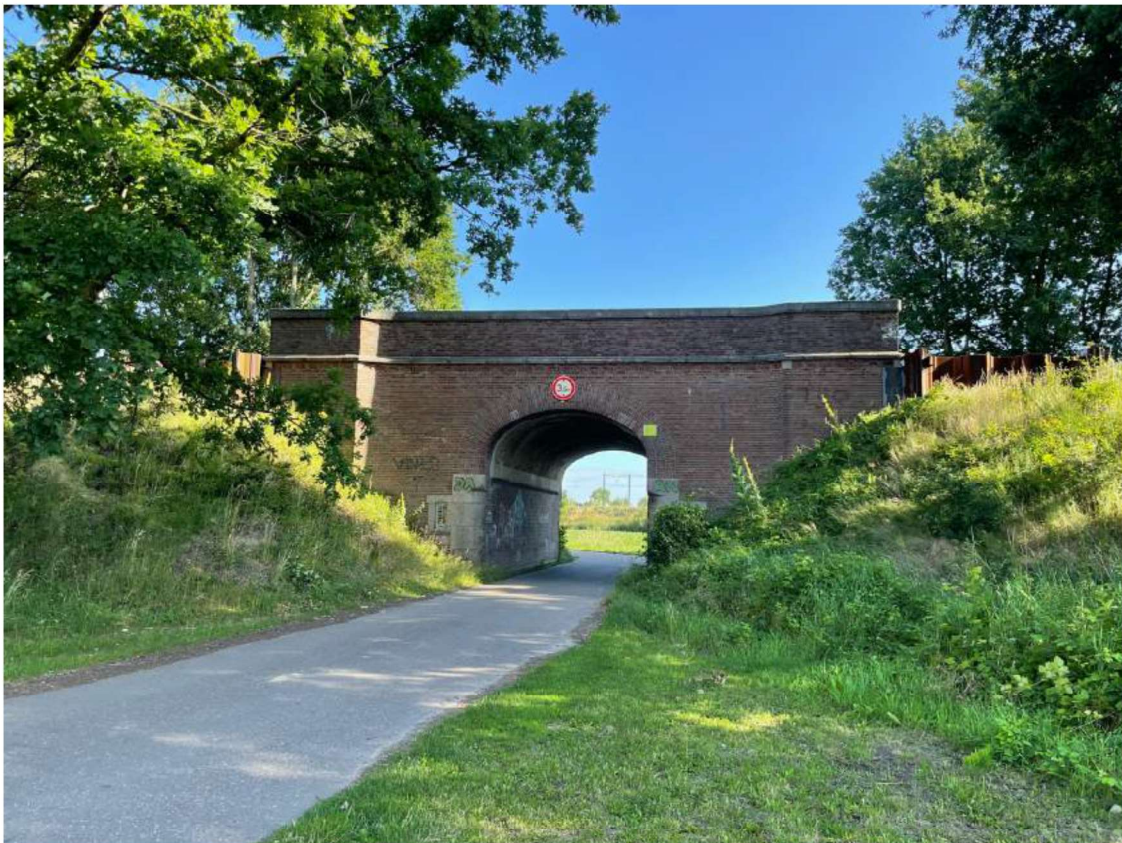
Foto 7 Zuidelijke bruggenhoofd De Voorste Singel.

De bruggenhoofden bij spoorbrug zijn van algemeen belang vanwege de cultuurhistorische waarde, architectonische en stedenbouwkundige waarde. De bruggenhoofden zijn van algemeen belang vanwege de cultuurhistorische waarde als bijzondere uitdrukking van een typologische ontwikkeling en de structurele groei die Weert doormaakte als gevolg van de industrialisatie en de aanleg van de Zuid-Willemsvaart. De bruggenhoofden zijn van algemeen belang vanwege de architectuurhistorische waarde vanwege de karakteristieke vormgeving, materiaalgebruik en detaillering. De brug heeft een stedenbouwkundige waarde vanwege het belang van het beeldbepalende karakter als onderdeel van de ontwikkelingen in het transportnetwerk van Weert.