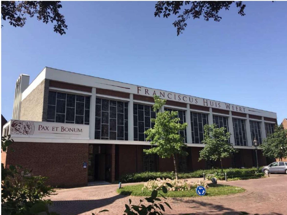
Foto 8 Noordelijke gevel Franciscus Huis Weert. Foto gemaakt door mw. R. Schonkeren (2020)