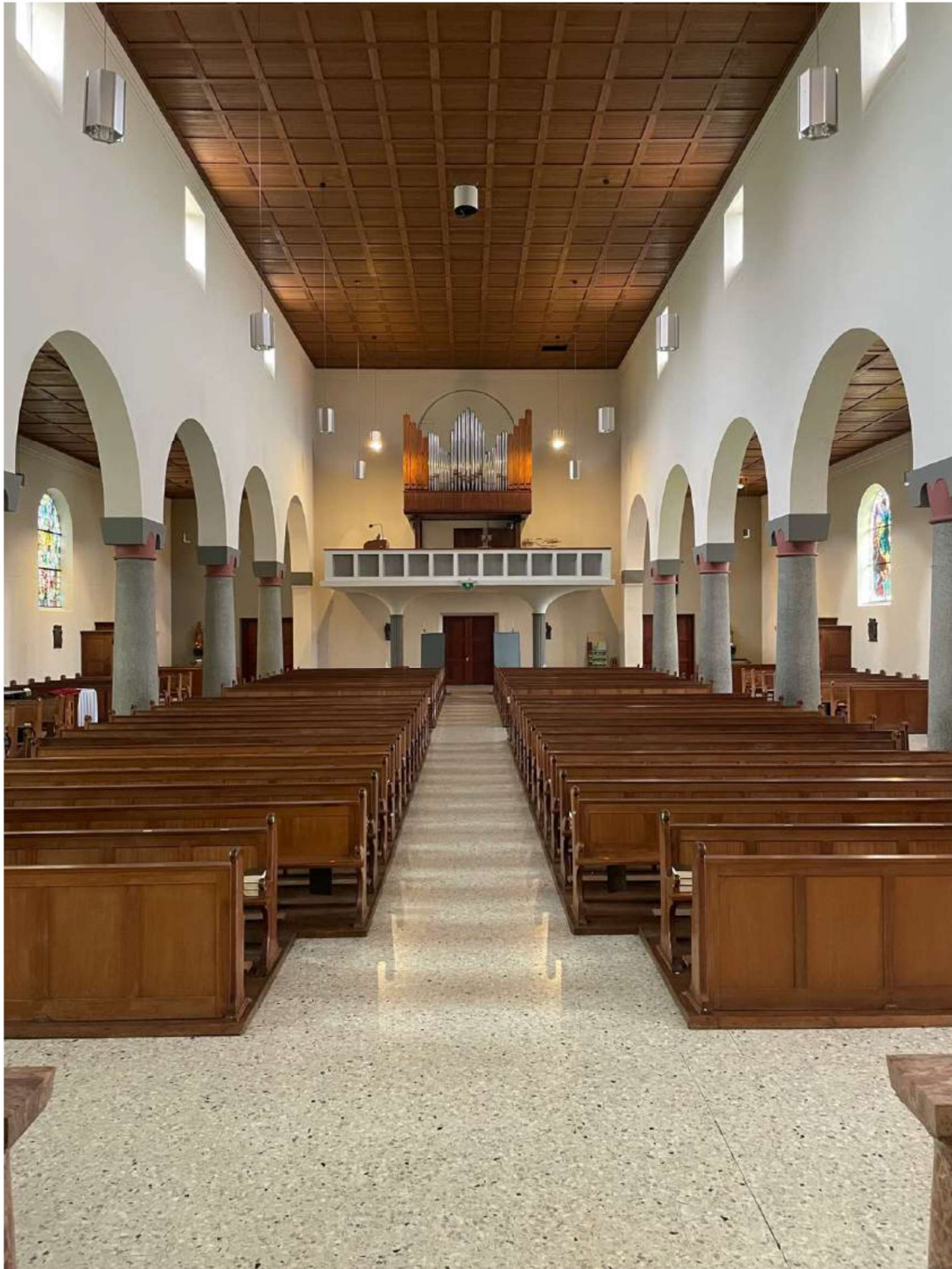
Foto 12 Interieur van de H.-Odakerk, gezien vanaf het koor richting de voorgevel.