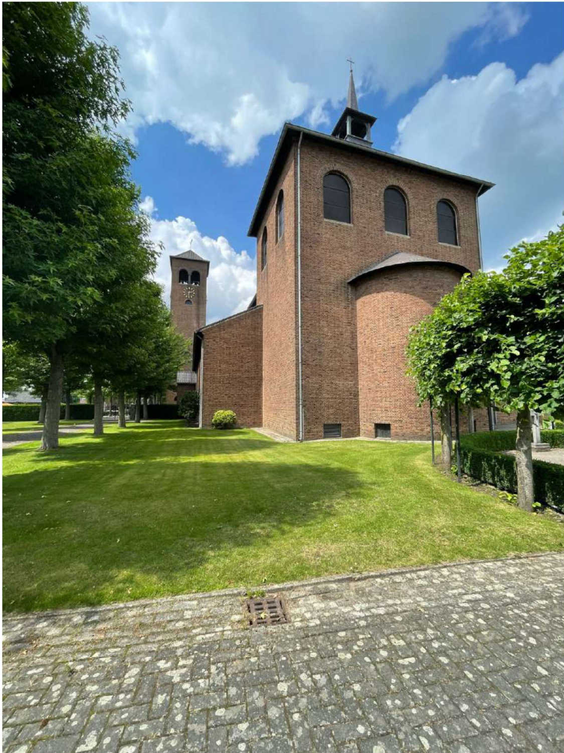
Foto 11 De achtergevel met absis van de H.-Odakerk in Boshoven, gelegen aan zuidoostkant.