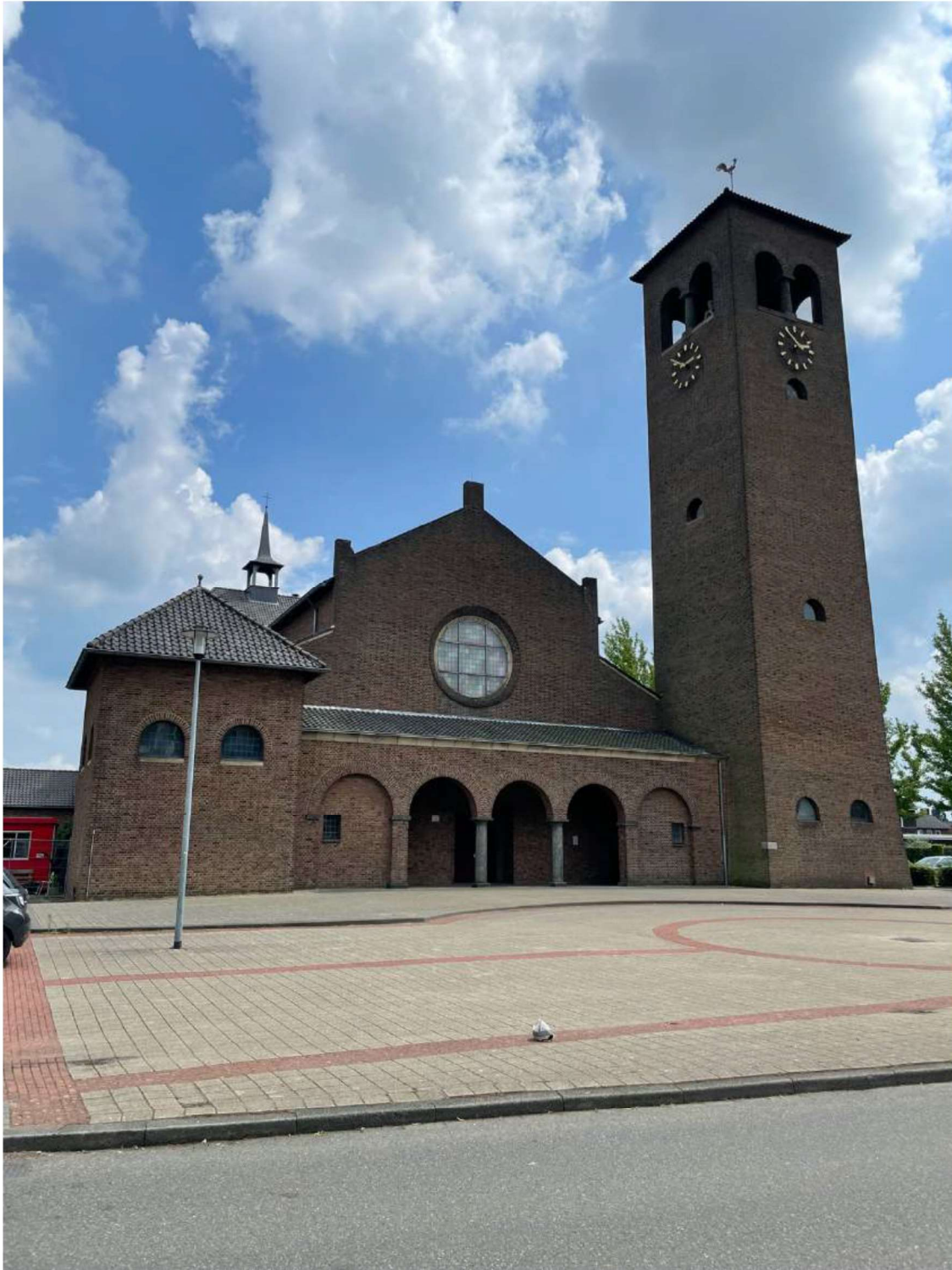
Foto 10 De voorgevel van de H.-Odakerk in Boshoven, gelegen aan noordwestkant .