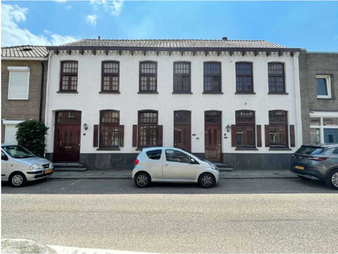
Foto 18 Voorgevel van de Molenpoort 1-3.