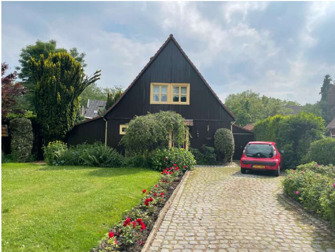
Foto 20 Voorgevel van de Oostenrijkse woning aan de Molenveldstraat 3.