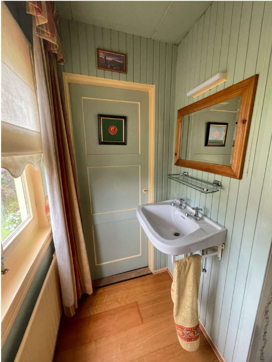
Foto 22 Het interieur ter plaatse van de slaapkamer grenzend aan de voorgevel, Molenveldstraat 3.