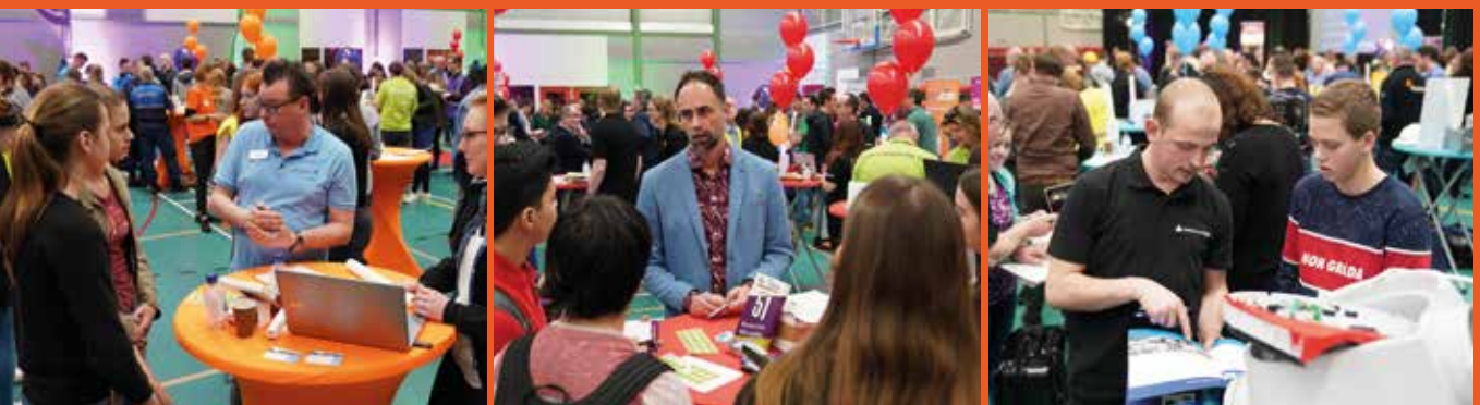
VMBO on Stage . Een beroepenfeest waarbij VMBO leerlingen kennismaken met carrierekansen in de regio. Georganiseerd in Weert en Roermond.