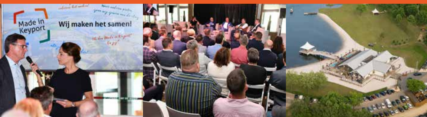
Keyport symposium 2019. Ontmoeting en triple helix samenwerking van bedrijven, onderwijs en overheid. Locatie: beachclub Degreez, gemeente Maasgouw.