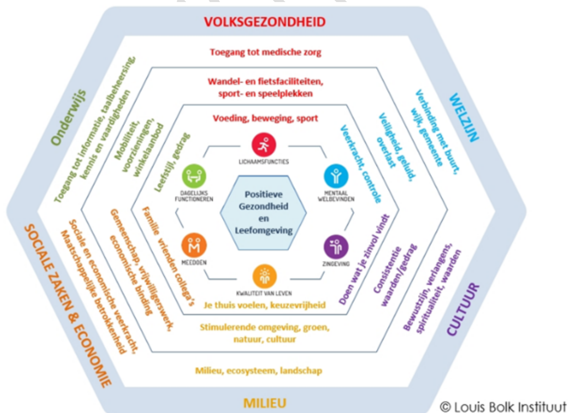
Figuur 2: Positieve Gezondheid en Leefomgeving

Weert wil een inclusieve gemeente zijn, waarin iedereen meetelt, meedoet en bijdraagt naar vermogen. We streven naar een solidaire samenleving waar onze inwoners zich thuis voelen, naar elkaar omkijken en mee kunnen doen naar vermogen. De behoefte en het talent van de inwoner staat daarbij centraal. We streven naar een situatie waarin de samenleving als geheel en mensen individueel keuzes maken die bijdragen aan een gelukkig, gezond, veilig en participierend bestaan. Het vitaal en gezond houden van onze samenleving is daarbij cruciaal voor het bouwen aan een solide toekomst voor onze inwoners. Gezondheid gaat daarbij over veel meer dan 'niet ziek zijn'. Gezondheid gaat over geluk, veiligheid, veerkracht, over meedoen in de maatschappij, betekenisvol werk doen of andere activiteiten en over de omgeving waarin je leeft. Het gedachtegoed van Positieve Gezondheid is het vertrekpunt wanneer we het hebben over gezondheid. Figuur 2 geeft de samenhang weer.