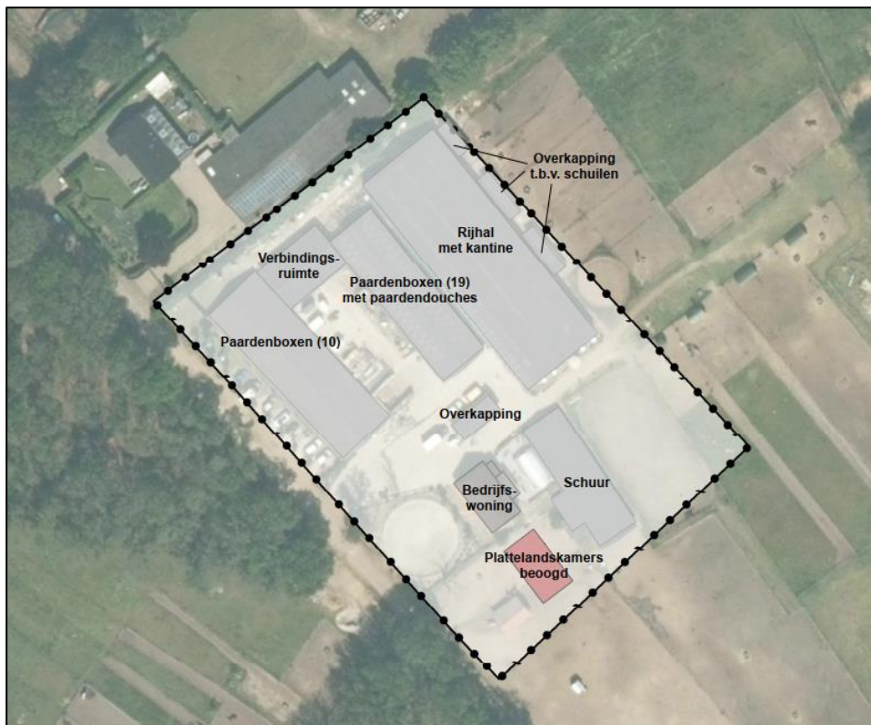
Figuur 3: Inrichting beoogde situatie

Alle activiteiten vinden, met uitzondering van de plattelandskamers, plaats binnen de bestaande bebouwing, dan wel ter plaatse van de bestaande rijbak, paddocks en paardenwei rondom het bouwvlak.