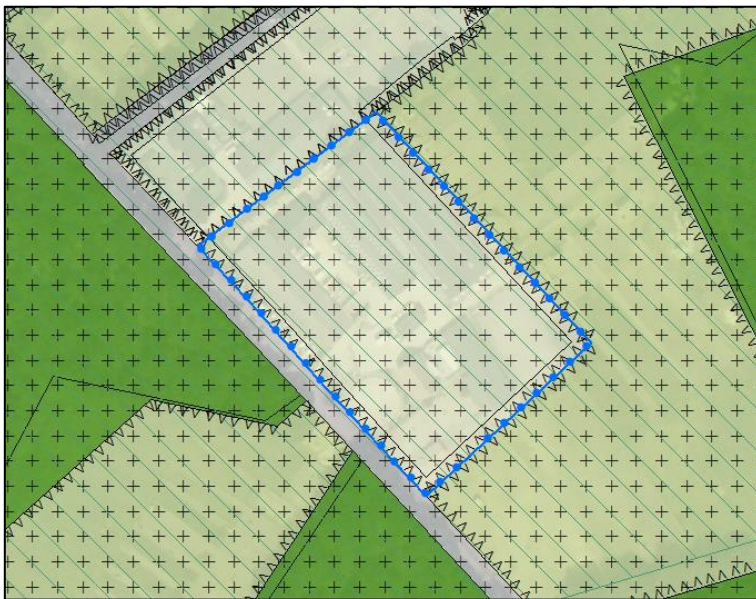
Figuur 2: Uitsnede bestemmingsplan 'Buitengebied 2011'

Het bestemmingsplan 'Buitengebied 2011' is door de gemeenteraad van Weert vastgesteld op 26 juni 2013 en onherroepelijk geworden bij uitspraak van de Afdeling Bestuursrechtspraak van de Raad van State op 18 februari 2015. Navolgend is een uitsnede weergegeven van het bestemmingsplan 'Buitengebied 2011', waarop de initiatieflocatie is aangegeven met blauwe bolletjeslijn.