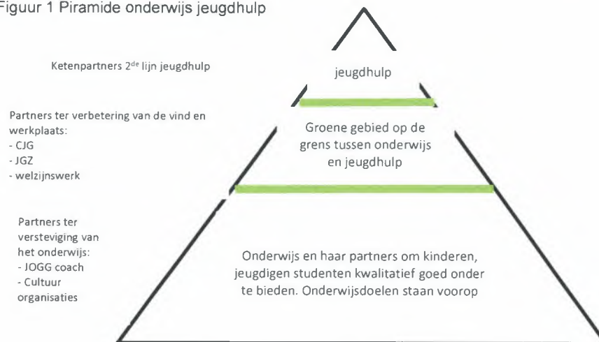
Figuur 1 Piramide onderwijs jeugdhulp

Zowel onderwijs als jeugdhulp staat voor een grote opgave. Het onderwijs wil met inclusief onderwijs het onderwijs passend maken voor elk kind. Jeugdhulp staat voor de uitdaging om nog integraler te werken, kwaliteit te verbeteren en dat tegen een betaalbare prijs. De verwevenheid van beide velden vraagt dus om een (langdurige) gezamenlijke aanpak.