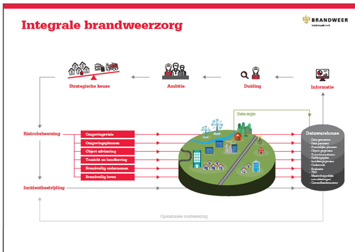
Afb. 1. Risicobeheersing binnen integrale brandweezorg

Risicobeheersing als onderdeel van de integrale brandweezorg staat in onderstaande afbeelding weergegeven. 2