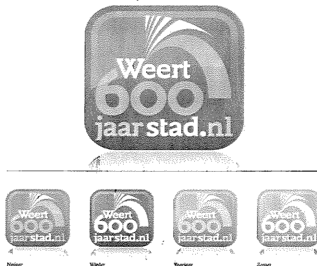
FIGUUR 2: HET BEELDMERK W600.