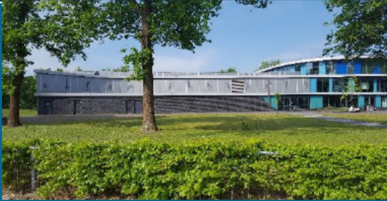
1. Aanbouw Sporthal St. Theunis