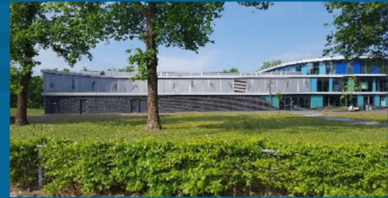
5. Zelf realisatie van