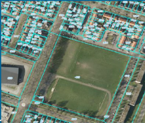
3. Nieuwbouw op locatie St. Louis aanbouw