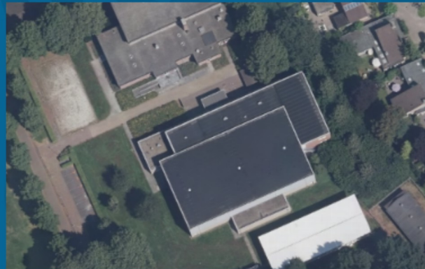
4. Huren sporthal Kazernelaan