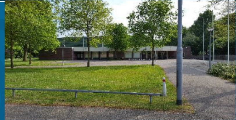
2. Aanbouw sporthal Boshoven