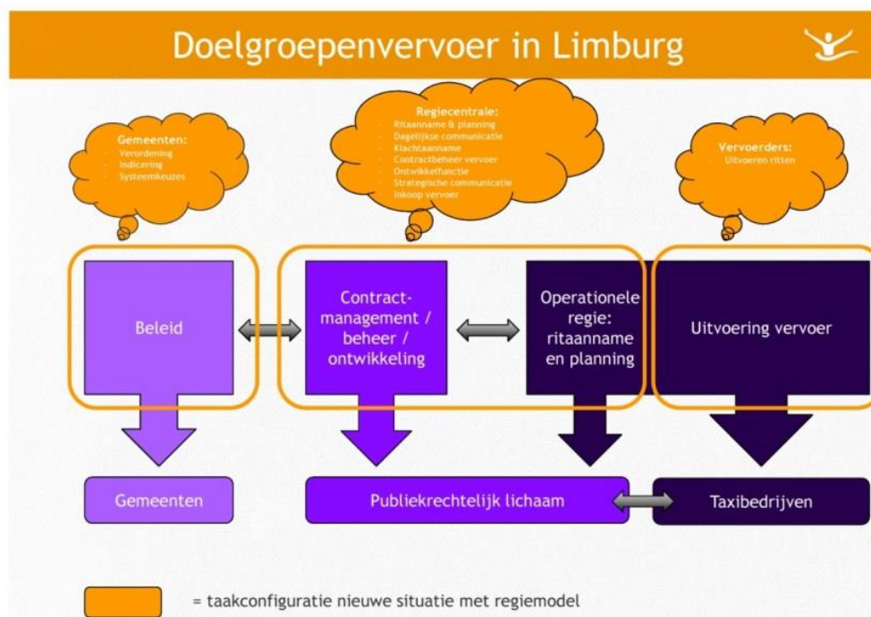
Figuur 1: Visualisatie Regiemodel

Om te sturen op de best passende vervoeroplossing voor de klant en een hogere efficiency in de uitvoering te realiseren, is gekozen voor een model met een scheiding tussen regie (mobiliteitscentrale) en de uitvoering van het vervoer. Dit model heet het regiemodel. In figuur 1 is de verschuiving van dit model ten opzichte van de oude situatie weergegeven.