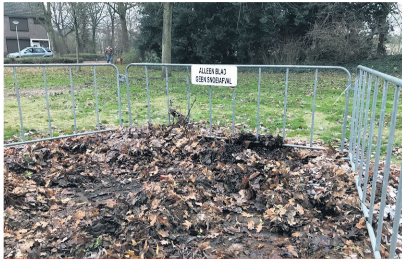
In een bladkorf mag alleen bladafval. Gooi er geen ander (tuin)afval in!

en wintermaanden (1 oktober tot 1 maart) kunt u bladafval daar gratis brengen. Dat kost u dus geen knip van de Weerterlandpas. Voor ander afval, zoals snoeiafval, takken, hout, puin of plastic, heeft u wél een Weerterlandpas nodig.