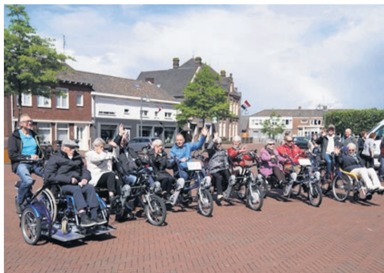
Voorbeeld van een idee: 'De fiets', een fietsprogramma voor mensen die graag willen fietsen maar dit niet meer zelfstandig kunnen.

Ga jij de uitdaging aan? Versterk de band met de buurt!