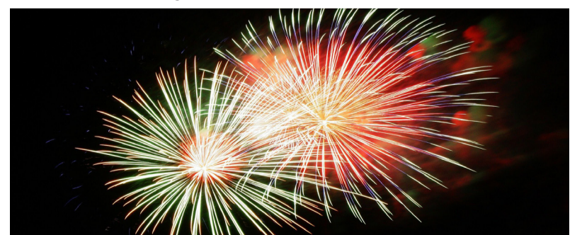
Vuurwerk met Oud en Nieuw hoort er helemaal bij. Houd wel rekening met elkaar en uw omgeving.

Of kijk voor meer informatie op www.rijksoverheid.nl/onderwerpen/vuurwerk .