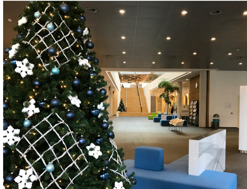
In de kerstvakantie zijn er aangepaste openingstijden. Kijk vooraf op de website, zo voorkomt u dat u voor een dichte deur staat.

Woensdag 25 en donderdag 26 december is de kinderboerderij gesloten. Ook Nieuwjaarsdag is de kinderboerderij gesloten. Op andere dagen is de kinderboerderij open op reguliere openingstijden: op werkdagen van 10.00 tot 16.00 uur en in het weekend van 10.00 tot 15.00 uur.