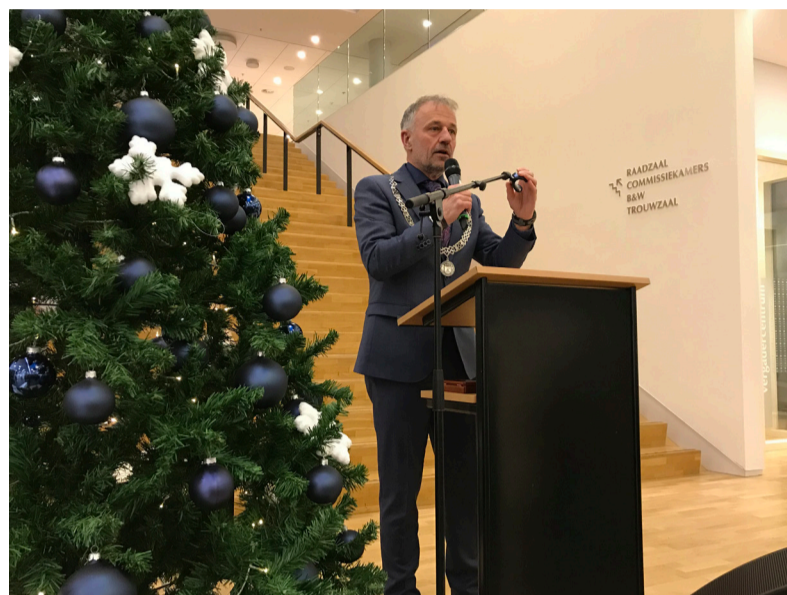
Tijdens de Nieuwjaarsontmoeting bent u van harte welkom, om met ons het glas te heffen op 2020!

De Nieuwjaarsontmoeting vindt plaats op vrijdag 3 januari 2020 van 16.00 tot 18.00 uur in de centrale hal