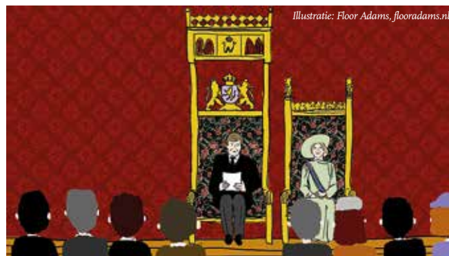
Illustratie: Floor Adams, flooradams.nl

PPD wil graag een bijdrage leveren aan de oplossingen om dit soort problematieken aan te pakken. Vanuit ons PPD Expertisecentrum staan diverse deskundigen uit ons bestuur en ons netwerk klaar om gemeenten en instanties te adviseren.