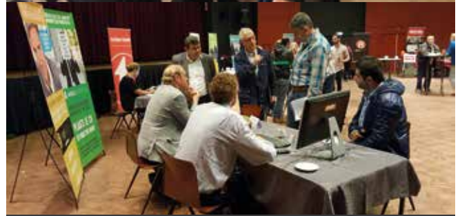
Foto's van eerdere succesvolle Banenmarkten van de PPD