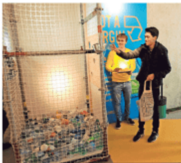
Een jongen gooit zijn PET-flessen weg in een grote mand.

Met zo'n 3.000 bezoekers, meer dan 7.000 ingeleverde PET-flessen en 1.355 euro aan donaties, spreekt organisator Ecover van de tijdelijke Statiegeld Store van een groot succes. Vorige week opende aan De Wilde Zee een tijdelijk inleverpunt voor PET-flessen waarmee het bedrijf de discussie rond statiegeld voor PET-flessen nieuw leven wil inblazen. «Plastic flesjes en blikjes zijn momenteel verantwoordelijk voor 40 procent van het volume van zwerfafval. Een statiegeldsysteem als oplossing is er voorlopig nog niet, want de regering blijft de beslissing uitstellen», klinkt het bij Ecover. De strijd tegen wegwerpplastic stopt voor Ecover niet na het sluiten van de Statiegeld Store. Van de ingeleverde PET-flessen in de Statiegeld Store gaat designer Dirk van der Kooij een 'discussietafel' maken. De tafel wordt nadien ingezet om verder over het onderwerp door te praten. (A14)