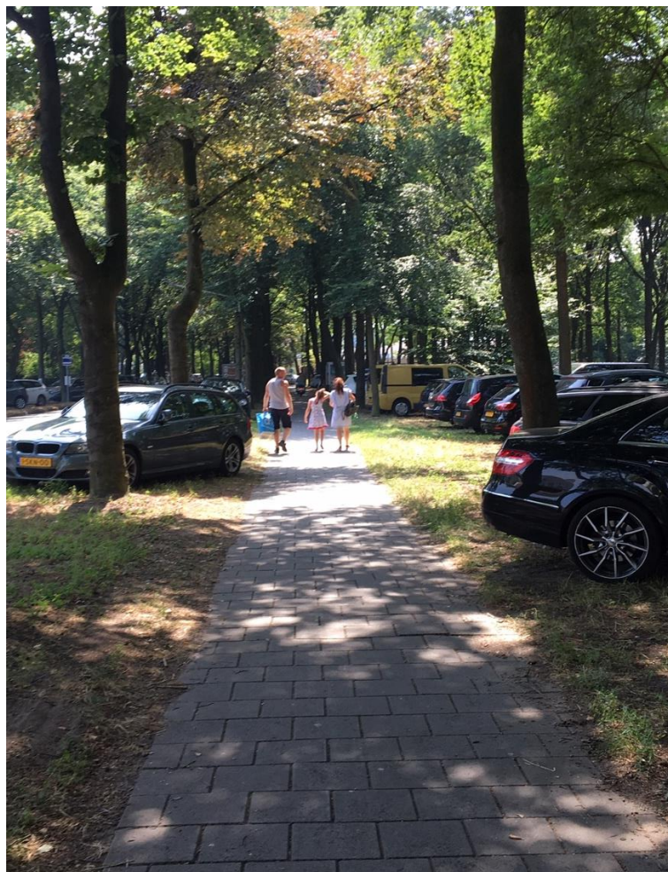
Figuur 8: Kazernelaan 25 juli