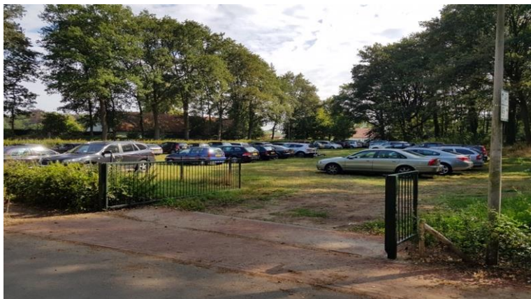
Figuur 19: Grasveld Dennen Noord 4 augustus