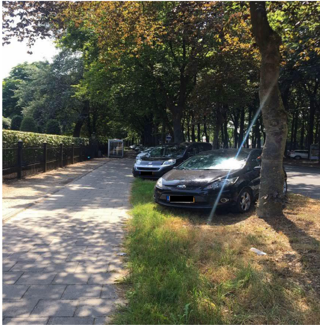
Figuur 4: Kazernelaan 25 juli

Hieronder vindt u een twintigtal foto's ter onderbouwing van de opmerkingen in hoofdstuk drie.