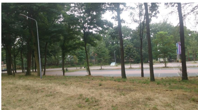
Figuur 11: Parkeerplaats IJzeren Man 27 juli