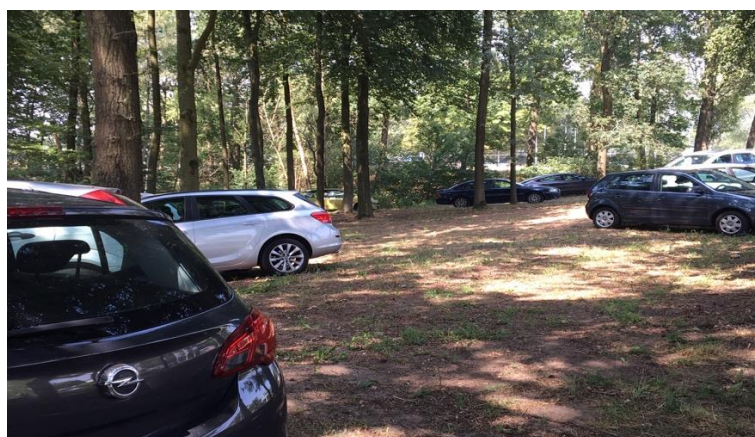
Figuur 9: Parkeerplaats IJzeren Man 25 juli