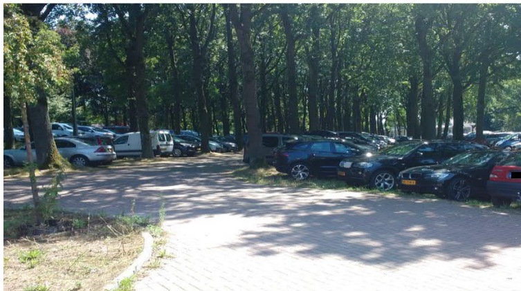
Figuur 16: Parkeerplaats IJzeren Man 30 juli