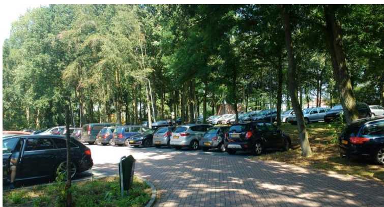
Figuur 14: Parkeerplaats IJzeren Man 30 juli