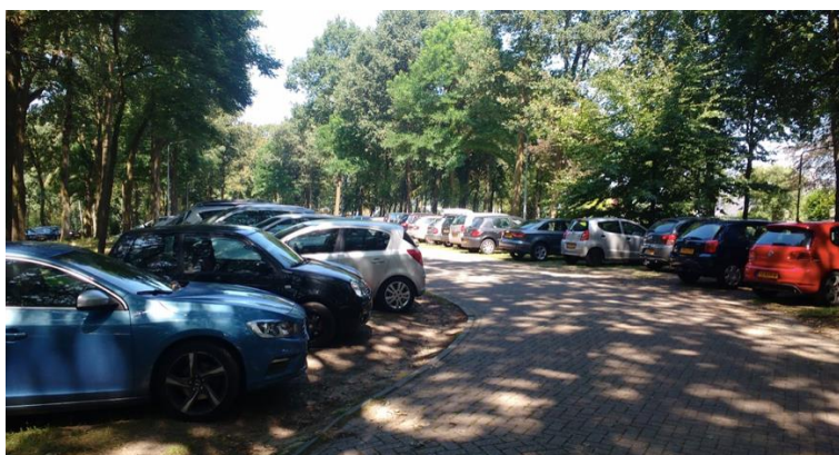
Figuur 15: Parkeerplaats IJzeren Man 30 juli