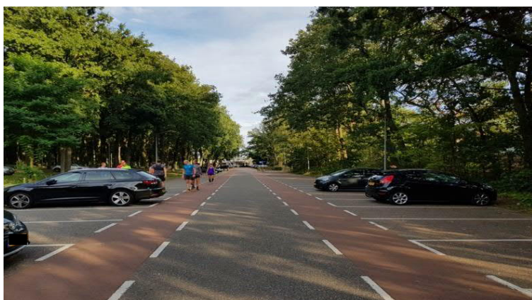
Figuur 23: Parkeerplaats IJzeren Man 8 augustus