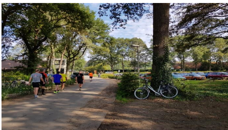
Figuur 17: Parkeerplaats Dennenoord 4 augustus