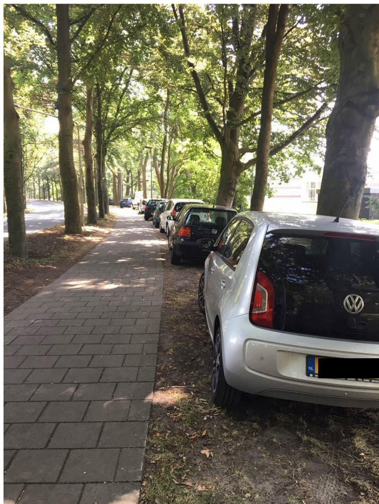
Figuur 6: Kazernelaan 25 juli