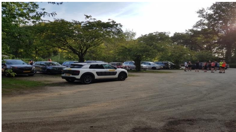
Figuur 22: Parkeerplaats Dennenoord 8 augustus