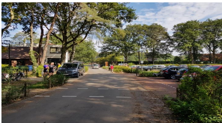
Figuur 18: Voorhoeveweg, Dennenoord 4 augustus