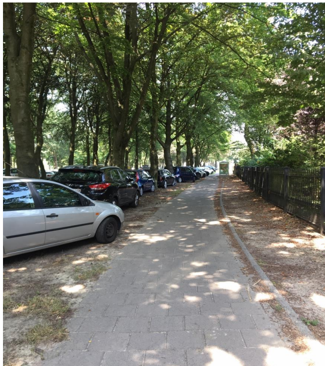
Figuur 5: Kazernelaan 25 juli