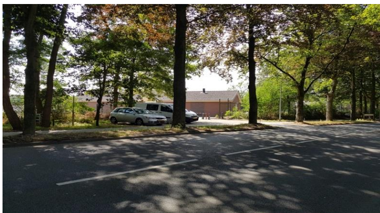
Figuur 21: Kazernelaan Duikclub 4 augustus