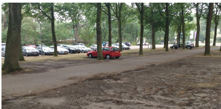
Figuur 12: Parkeerplaats IJzeren Man 27 juli