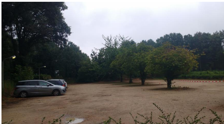
Figuur 13: Parkeerplaats Dennenoord 27 juli