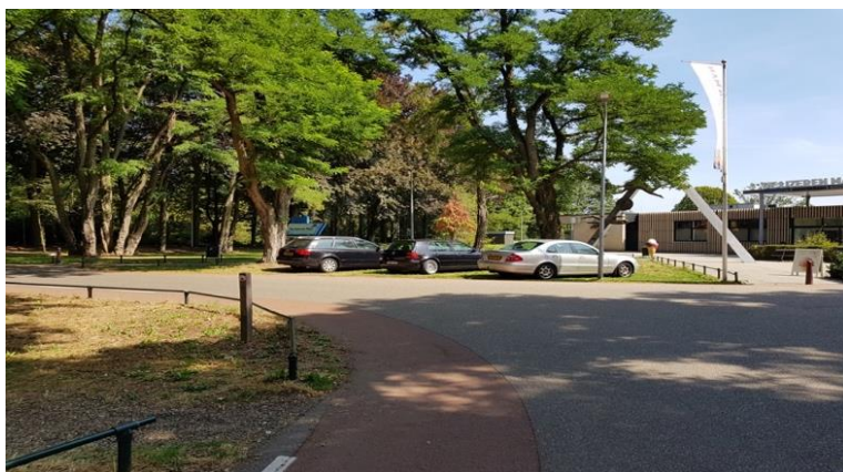
Figuur 20: Parkeerplaats IJzeren Man 4 augustus