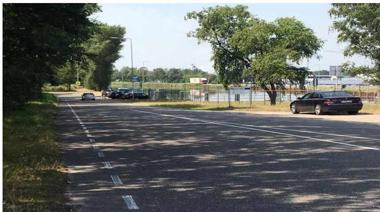
Figuur 10: Lozerweg aan kanaal 25 juli