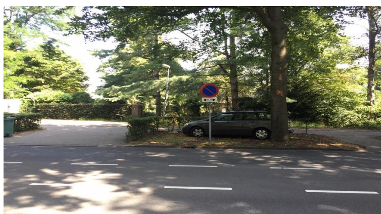
Figuur 7: Kazernelaan 25 juli