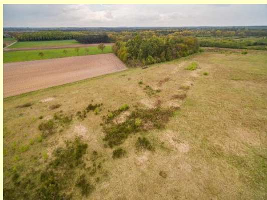
Luchtfoto Bocholtergraven toont de ligging van de Bocholtergraven. Het verloop is te herkennen aan de lijnvormige structuur in de vegetatie. Project Grensgevallen onderzoekt op welke manier de graven zichtbaar gemaakt kunnen worden in het landschap.