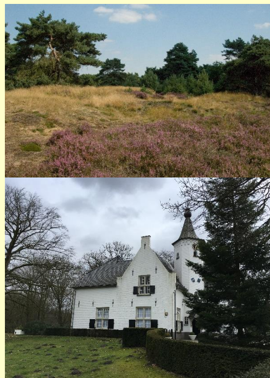
Foto's van een tweetal parels uit het gebied. Van boven naar beneden:

Om het gemeenschappelijke en bijzondere karakter van het gebied te illustreren, is een parelroute voorgesteld. De verbinding van deze parels via een toeristische fietsroute laat de inwoner/recreant/toerist de samenhang en de schoonheid van het gebied zien. De parels wijzen op specifieke plekken/gebouwen, maar in het gebied zijn veel meer parels aanwezig.