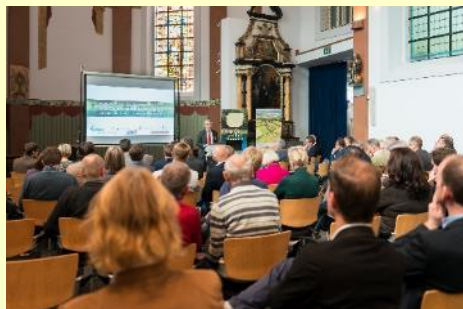
Netwerkbijeenkomst 3 november 2016 in het stadhuis in Bree.

We vragen u om 26 oktober van 17.00 tot 19.00 uur alvast in de agenda te noteren. Een mooi moment om met alle samenwerkende partijen het glas te heffen op de samenwerking én om u allen meer te vertellen en te laten zien over de diverse projecten.