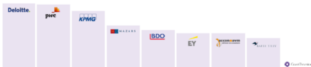
Figuur 1 – Uitkomst onderzoek naar de verandertrajecten bij de OOB-accountantsorganisaties Verwachtingen voor 2016

De AFM oordeelt positief over Deloitte, wat ons sterkt in het vertrouwen in de juistheid van de door ons ingeslagen weg. Wij herkennen ons in datgene dat in het rapport omschreven staat, zowel wat goed gaat en de genoemde good practices, alsook waar nog verbeteringen mogelijk zijn. Dit totaalbeeld strookt met de uitkomsten van onze eigen periodieke evaluatie van ons stelsel van kwaliteitsbeheersing en de continue impact analyses op initiatieven vanuit onze kwaliteitsagenda. De uitkomsten van het onderzoek naar de implementatie en borging van verandertrajecten bij de onderzochte OOB-accountantsorganisaties versus de verwachtingen is opgenomen in figuur 1.