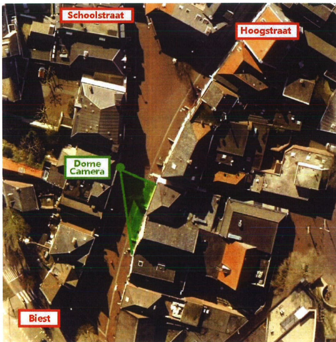
Afbeelding 3: huidige situatie met één dome-camera op de Oelemarkt

In de huidige situatie op afbeelding 3 kan de camera enkel een beperkt deel van de Oelemarkt waarnemen. Een totaal overzicht is er niet. Dat wil zeggen dat als er zich een incident voordoet, waar de camera op dat moment niet op gericht staat er geen beeldopnamen worden geregistreerd. Momenteel neemt de politie contact op met de meldkamer op het moment zich iets voordoet. Op die manier kan de observant de camera sturen en de registratie laten plaatsvinden. Kanttekening daarbij is dat op het moment de observant gaat inzoomen ook enkele deze beelden worden geregistreerd. Het nadeel bestaat dat andere activiteiten op dat moment niet kunnen worden opgenomen.