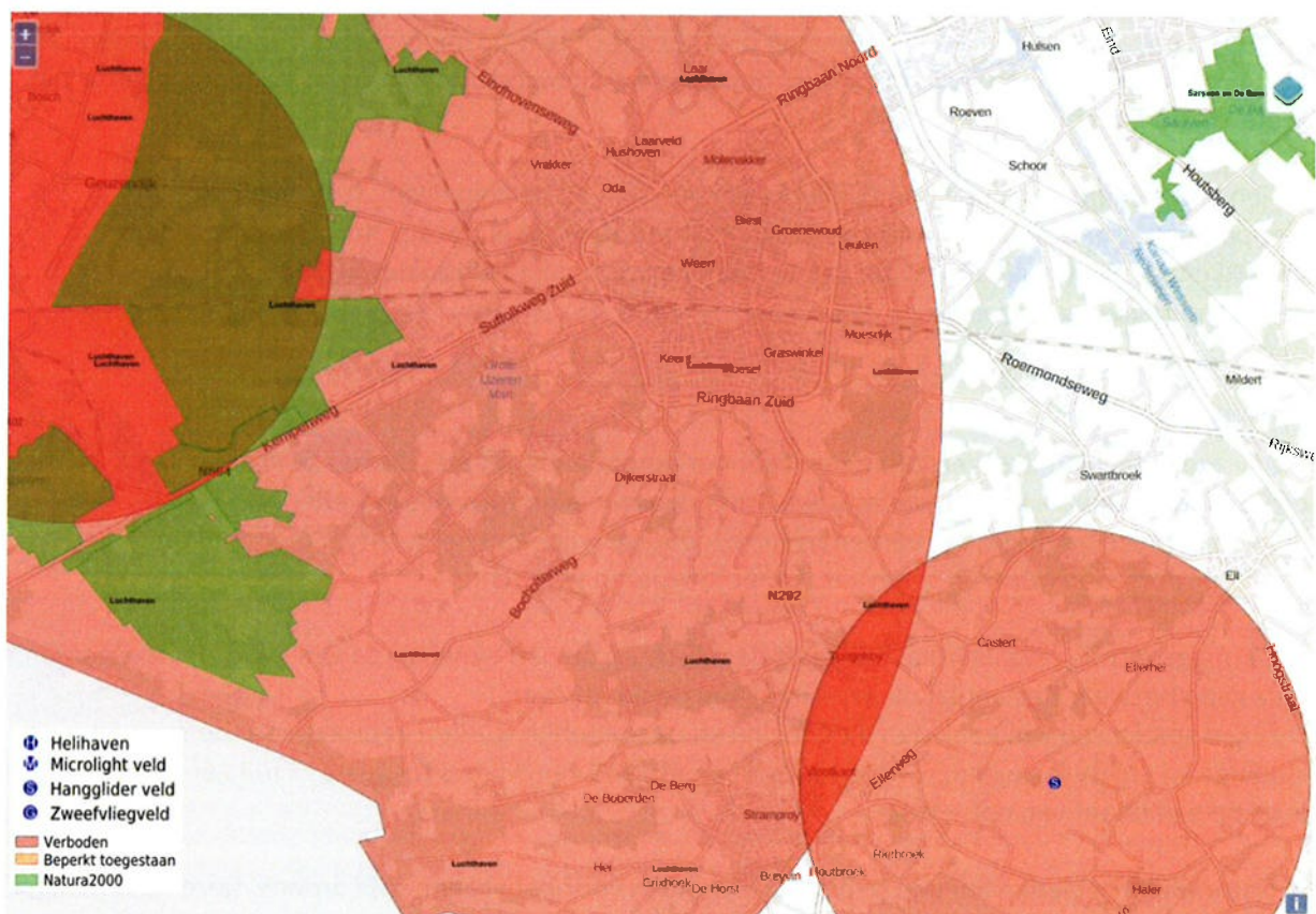
Afbeelding 1; No fly zone boven Weert

De komst van drones heeft in principe geen gevolgen voor de APV, tenzij er bepaalde gebieden in de gemeente zijn waar het vliegen met drones moet worden verboden. Voor Weert geldt dat een groot deel van de gemeente valt binnen een 'no fly zone', gezien op afbeelding 1 . Daar mag sowieso niet gevlogen worden met een drone. Dat heeft te maken met de ligging van de luchthaven in Budel 'Kempen Airport'. Voor de bebouwde kom is een drone-verbod niet nodig, omdat het immers al is verboden om boven aaneengesloten bebouwing te vliegen.