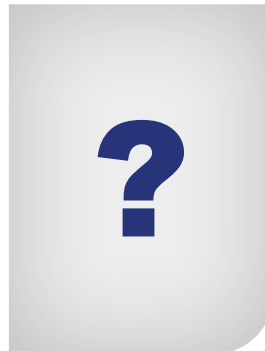
Vacature Specialist duurzaamheid