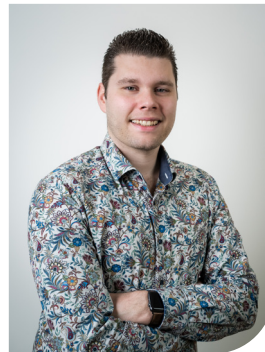
Sander Bus Specialist communicatie