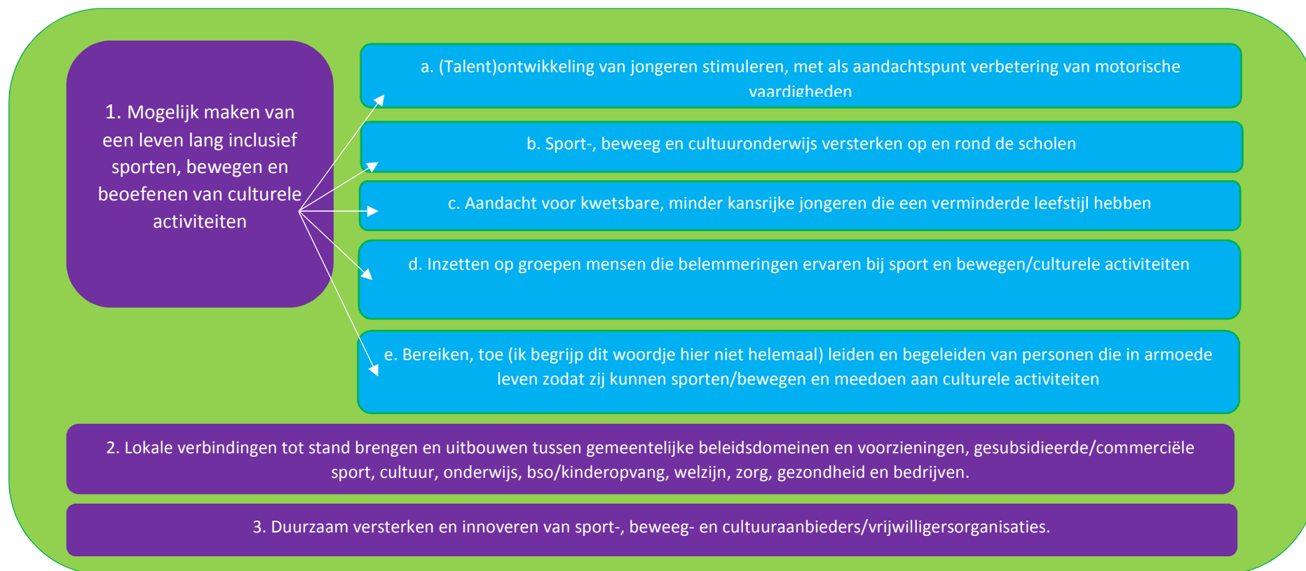
Fig.1. Landelijke doelstellingen combinatiefuncties

genomen worden. In het laatste geval wordt het totaal aan kosten gedeeld door de richtlijn van 1 fte = € 50.000,-. Mocht het aantal afgesproken fte's incidenteel niet behaald worden dan informeert het Min. VWS welke redenen hieraan ten grondslag liggen. Hierop volgen geen sancties, terugbetaalverplichting of anderszins. Mocht het aantal fte's structureel niet behaald worden dan zal het Min. VWS aandringen op het bijstellen van de intentieverklaring naar een lager aantal fte's. Gemeenten hebben namelijk de mogelijkheid om voor 60%,80%,100%,120% en 140% deel te nemen aan de regeling. Weert doet voor 140% mee.