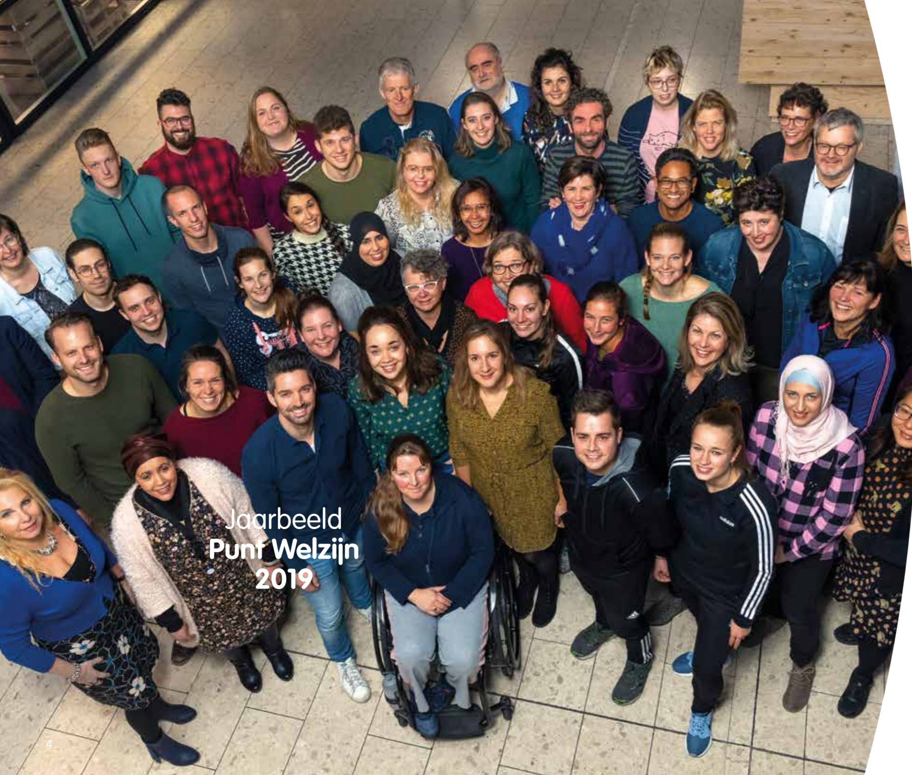
Jaarbeeld Punt Welzijn 2019